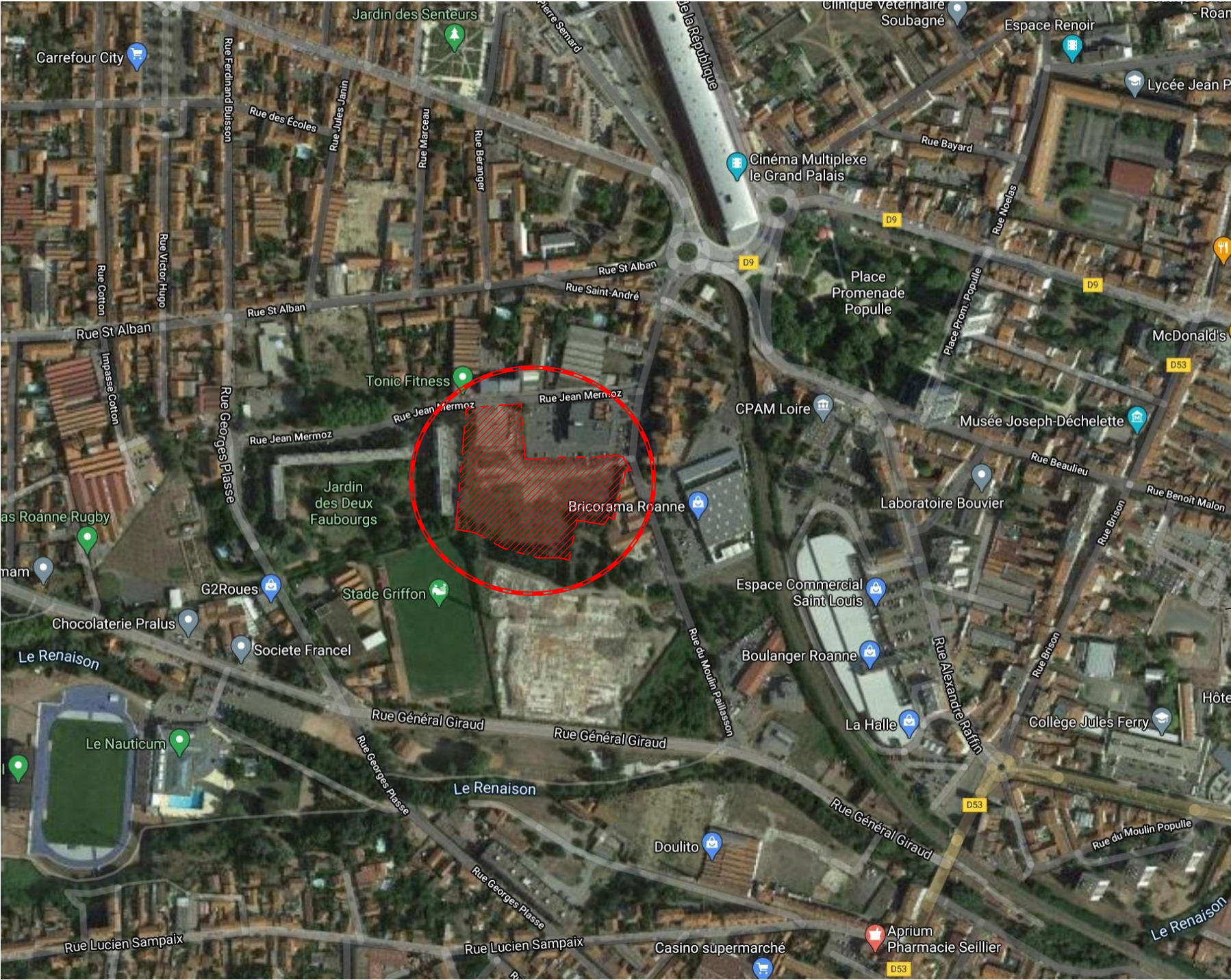
Commune de ROANNE Photo aérienne 1:5000