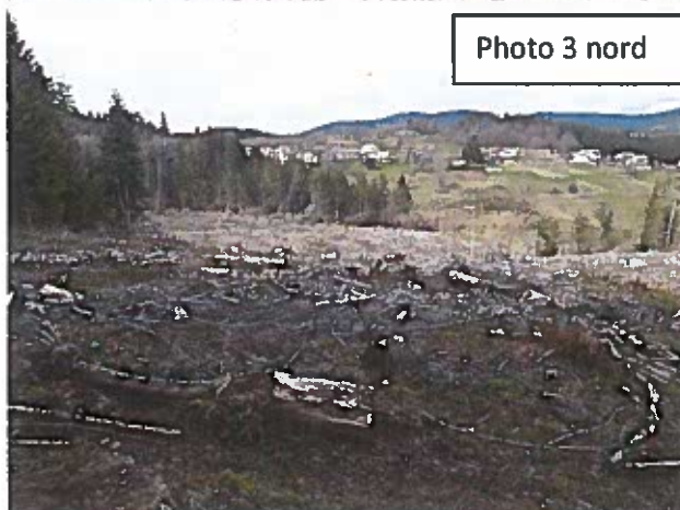
Photo 3 nord