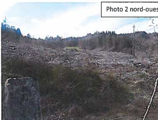
Photo 2 nord-ouest