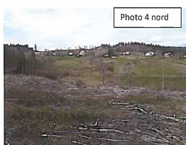
Photo 4 nord