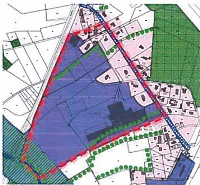
Figure 1. Plan de zonage – périmètre OAP.