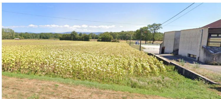
Vue sur le secteur d'études