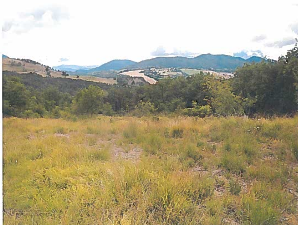
Photo n°2 situation du projet dans l'environnement proche. Photo prise dans la parcelle sur la coupe.