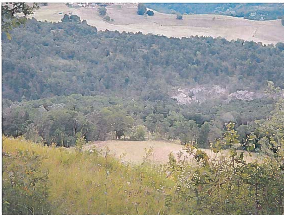
Photo n°1 situation du projet dans le paysage lointain. Un linéaire boisé a été maintenu le long de la parcelle, l'impact sur le paysage lointain étant peu important.

Photos du 24 juillet 2017. Coupe des pins sylvestres réalisées entre 2012 et 2015 mais terrain non dessouché.