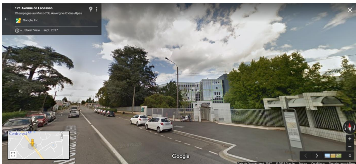
Photographie n° 3 du site depuis l'avenue de Lanessan