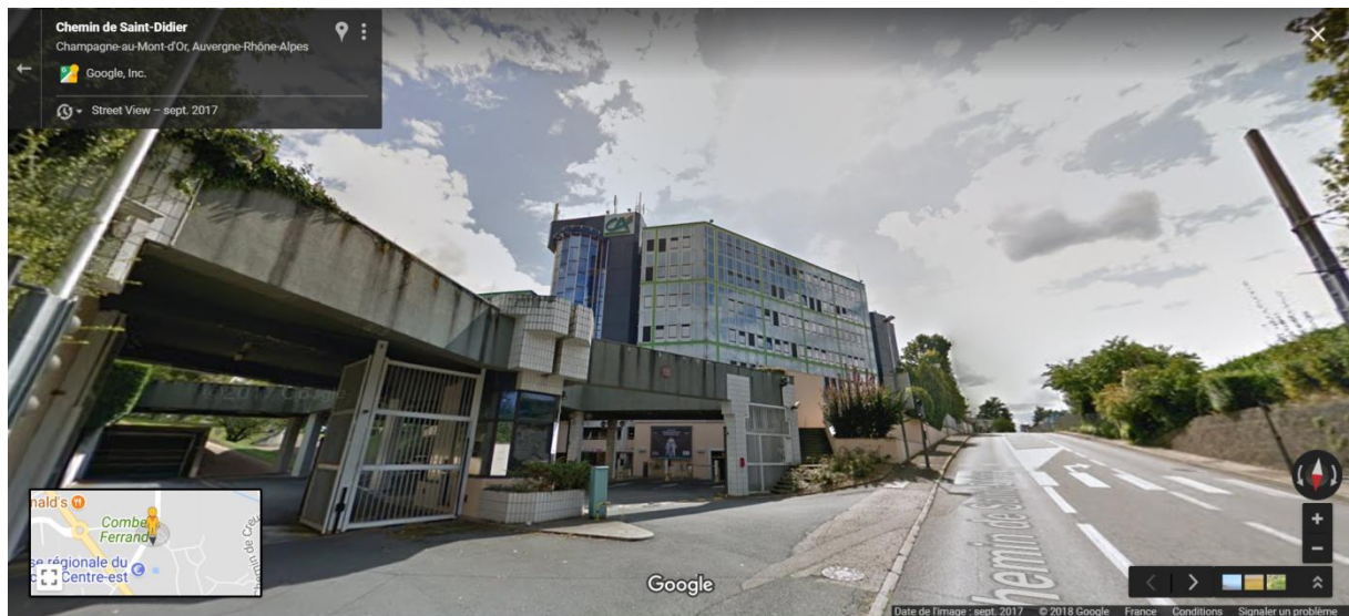
Photographie n° 1 du site depuis le chemin de Saint Didier