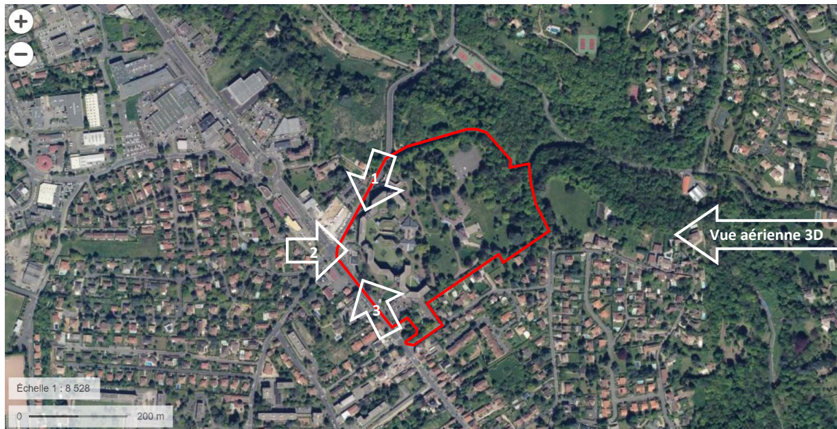
Localisation des photographies sur vue aérienne