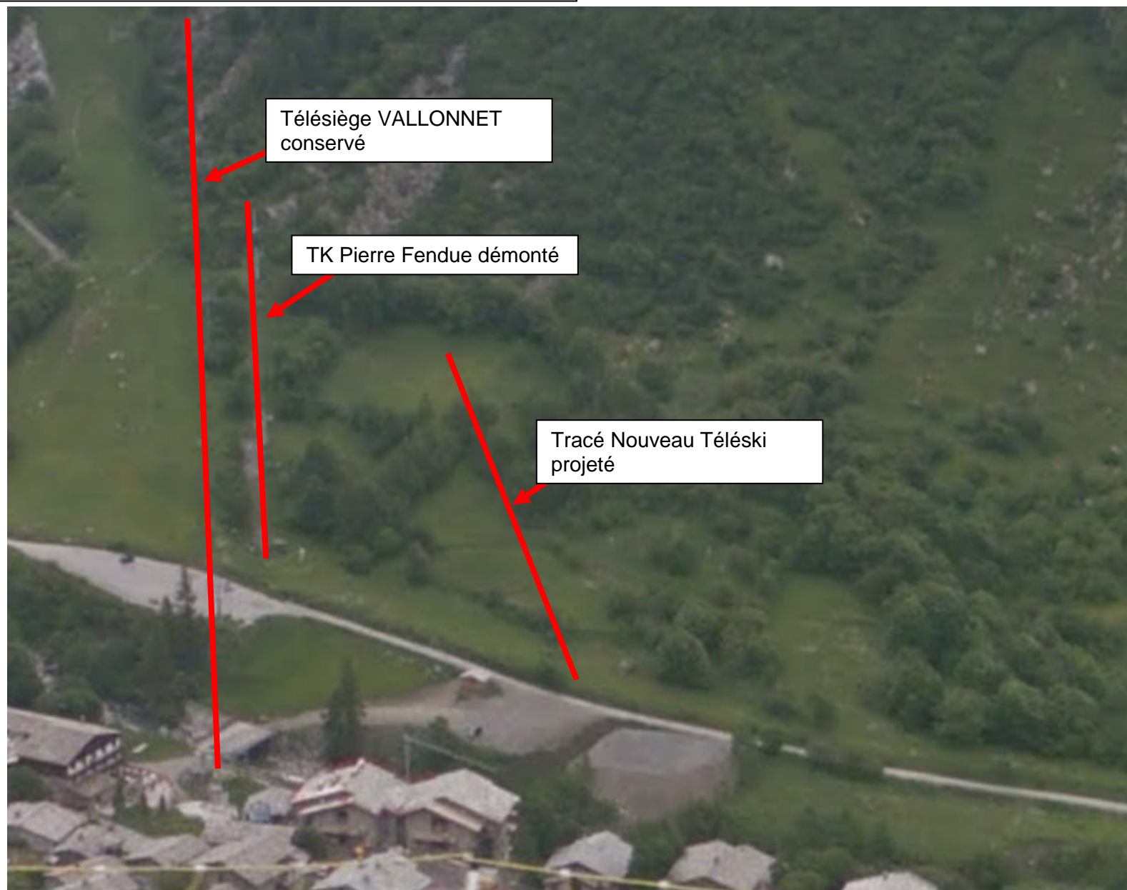
Photo N°2 : Vue du nouveau télési depuis la route D902 – Juin 2014