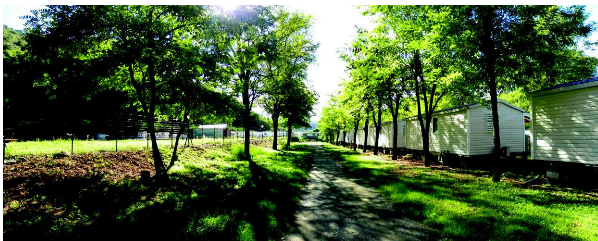
Figure 6 : A droite, les emplacements de RML à régulariser ; à gauche, secteur envisagé pour l'extension