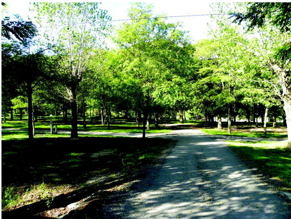
Figure 1 : Vue sur les emplacements actuellement autorisés (tentes)