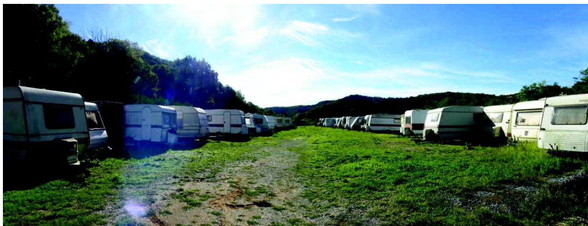
Figure 5 : Zone de stockage de caravanes