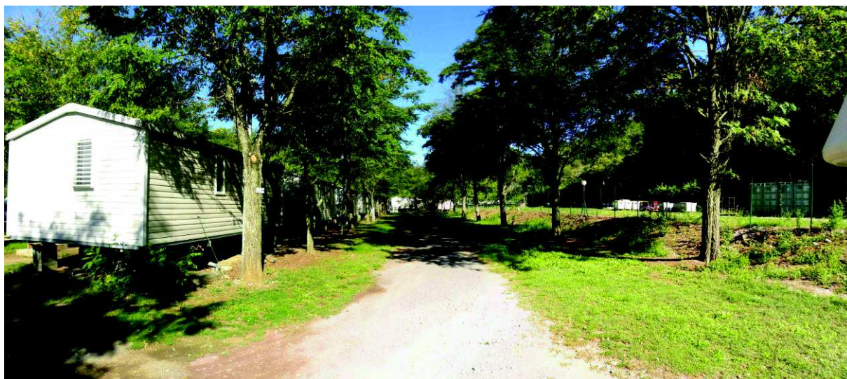
Figure 3 : A gauche, les emplacements à régulariser : à droite le secteur envisagé pour l'extension