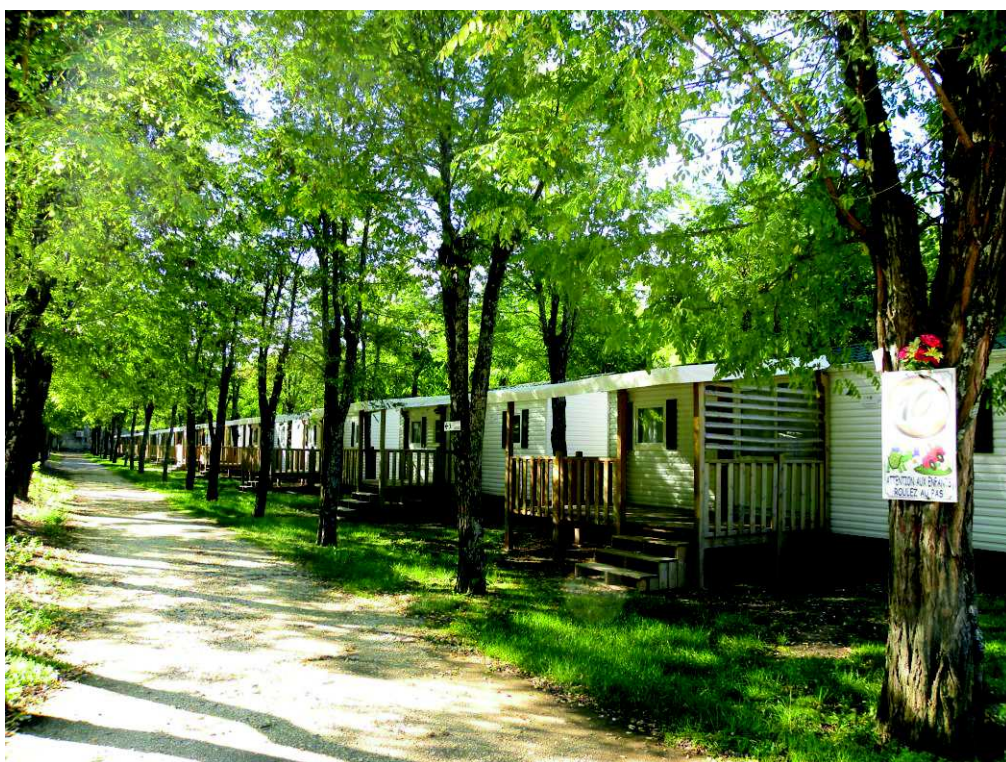
Figure 2 : Vue sur les emplacements actuellement autorisés (RML)