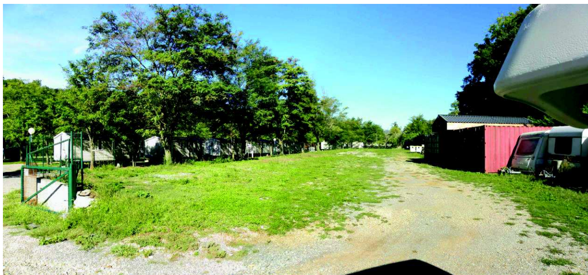
Figure 4 : Secteur disponible pour l'extension ; en arrière-plan, les emplacements occupés par des RML à régulariser