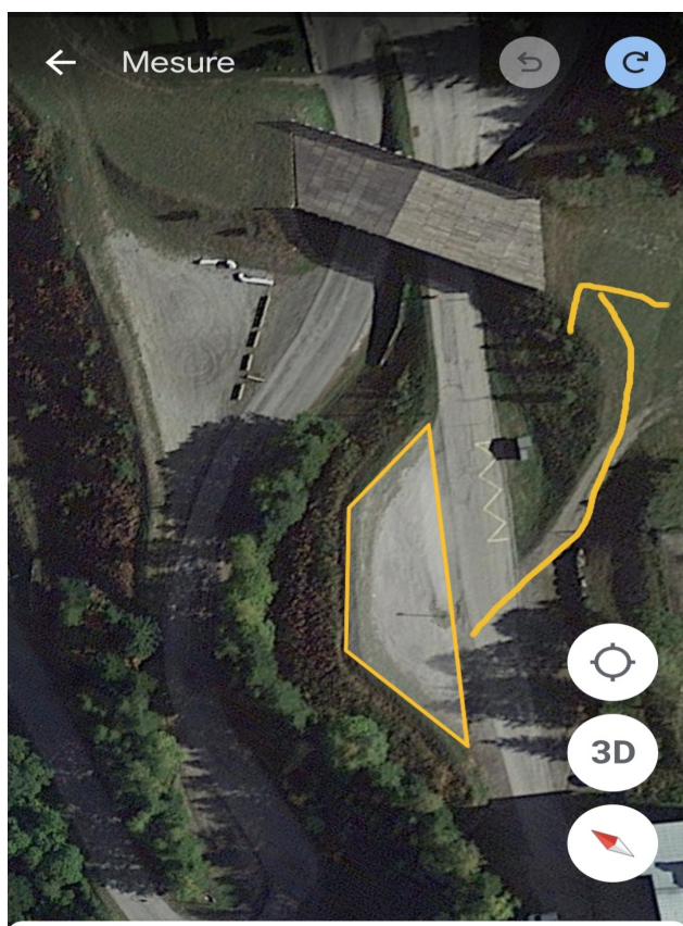
Parking n°1 :

De plus nous estimons que 70 à 80% de la clientèle se rendrons à pied étant donné que l'activité est à 300m du centre du village par la piste ou se trouve la moitié de la capacité d'accueil de la station et à 900m du chalet le plus éloigné de la station par la route.