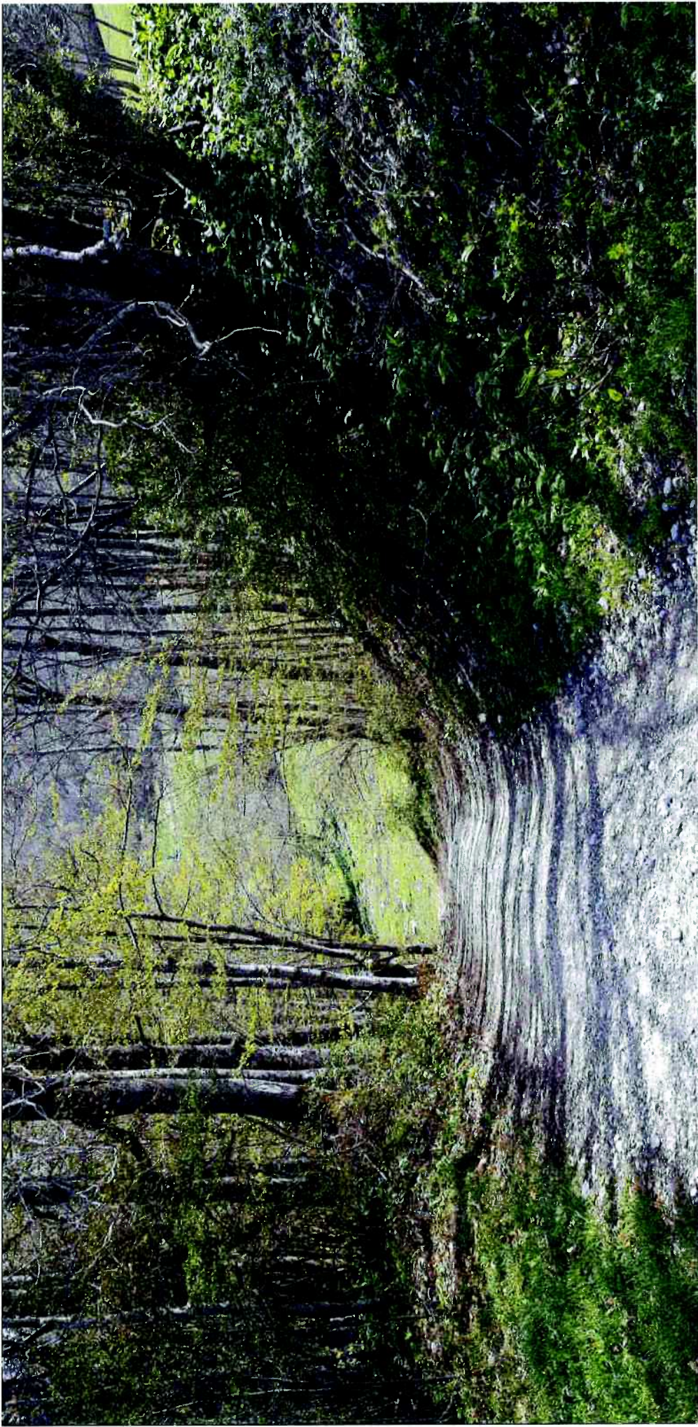
Dans l'emprise du projet