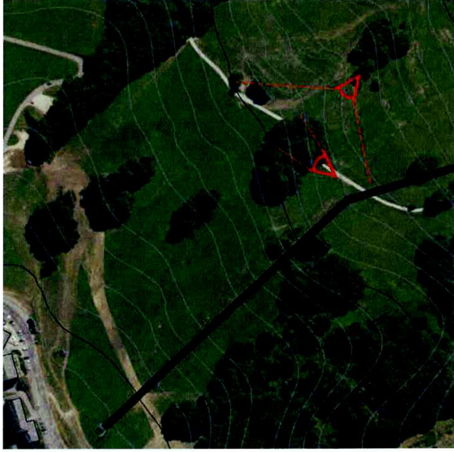
Points de vue