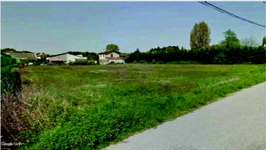
Photographie Lointaine - Repère VUE N°2