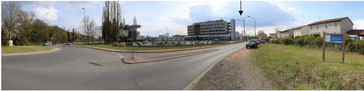
Photo 4 : Vue du site depuis le giratoire de la rue des Ailes (RD6E)

L'accès à la clinique se fait par un axe à grande circulation. A droite se trouve la zone d'habitation du lotissement des Saules. L'extension se fera derrière le bâtiment existant de la clinique.