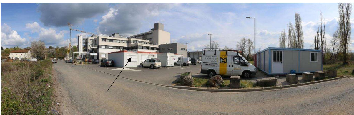
Photo 3 : Vue du site à l'entrée arrière de la clinique depuis l'allée des Ailes

L'extension se fera entre la zone de dépôts et le bâtiment actuel.