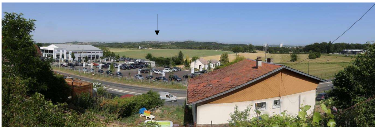
Photo 10 : Panorama depuis le hameau « les Calabres » (à 1,35 km à l'ouest du projet)

La photo est prise depuis un relief bordant la vallée de l'Allier. Le site de la clinique est caché derrière l'imposante ripisylve de l'Allier.