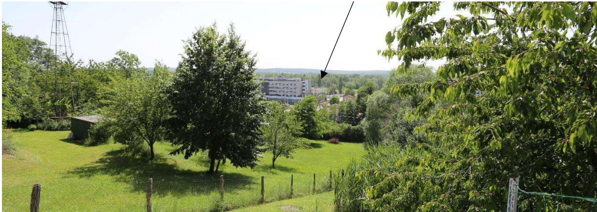
Photo 7 : Panorama depuis le hameau « les Pins » (à 300 m à l'est du projet, altitude 277 m)

La photo est prise depuis le relief bordant la vallée de l'Allier. Le site de la clinique est difficilement perceptible depuis les espaces publics (voir flèche). Il est caché derrière les bâtiments existants et la végétation.