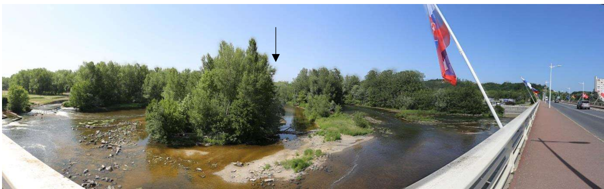
Photo 9 : Panorama depuis le Pont de l'Europe (à 930 m au sud du projet)

La photo est prise depuis le giratoire entre la rue des Ailes et la route du Pont de l'Europe. Le site de la clinique est caché derrière la végétation arborescente des espaces verts.