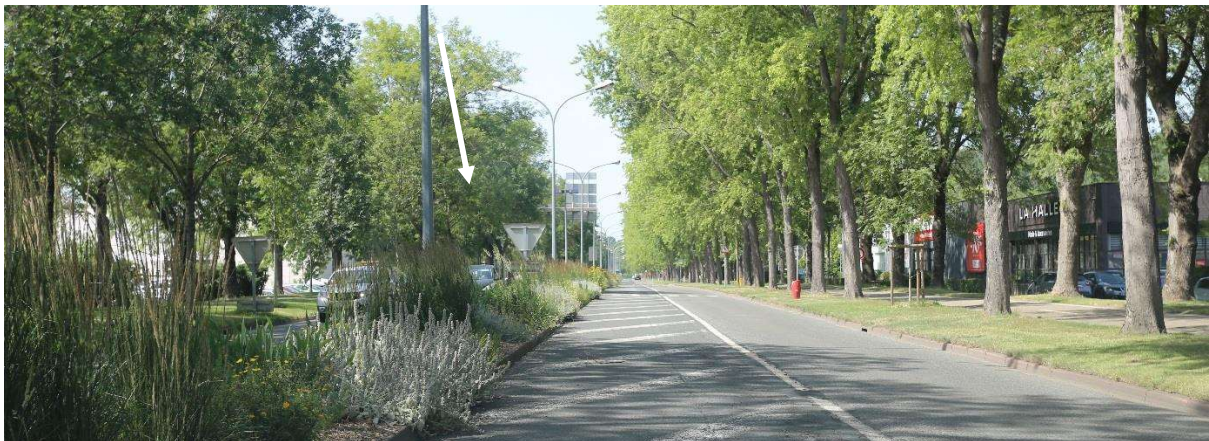
Photo 8 : Panorama depuis la rue des Ailes (à 900 m au sud du projet)

La photo est prise depuis le relief bordant la vallée de l'Allier. Le site de la clinique est difficilement perceptible depuis les espaces publics (voir flèche). Il est caché derrière les bâtiments existants et la végétation.