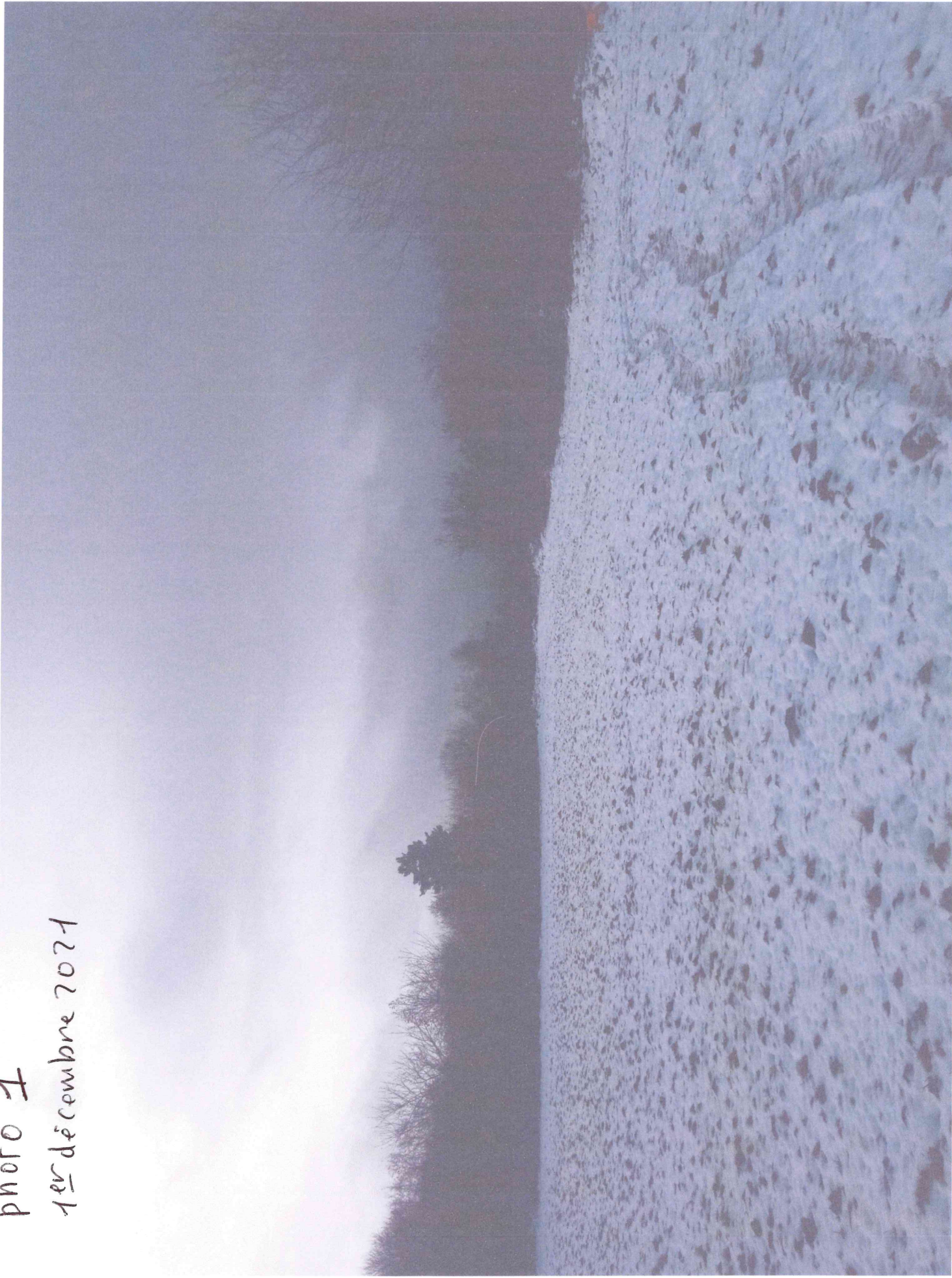
photo 1 1er décembre 2021