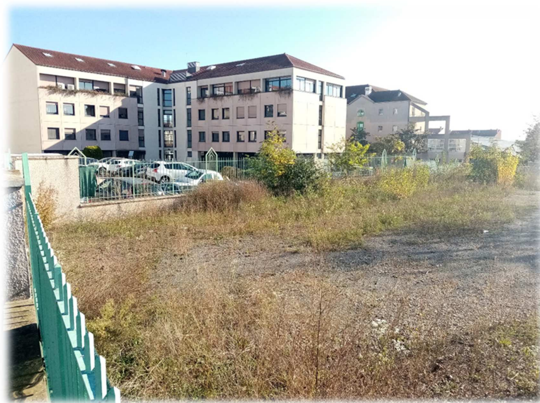
Prise de vue n°3 – Novembre 2021