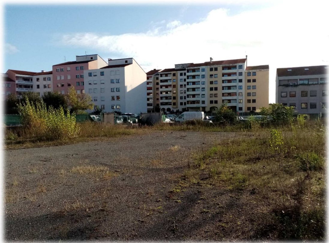
Prise de vue n°7 – Novembre 2021