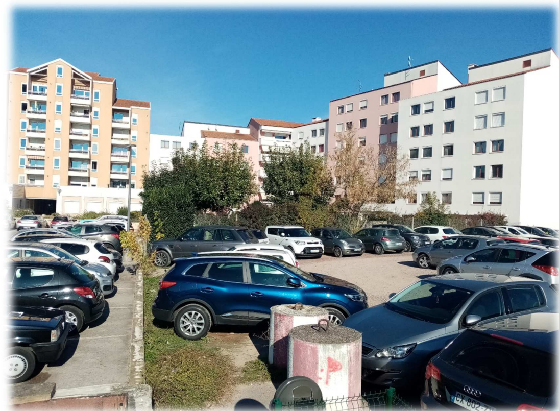
Prise de vue n°6 – Novembre 2021