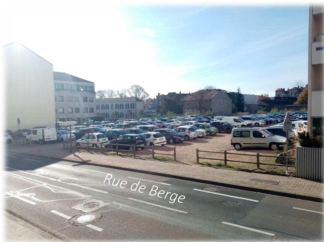
Prise de vue n°1 – Novembre 2021