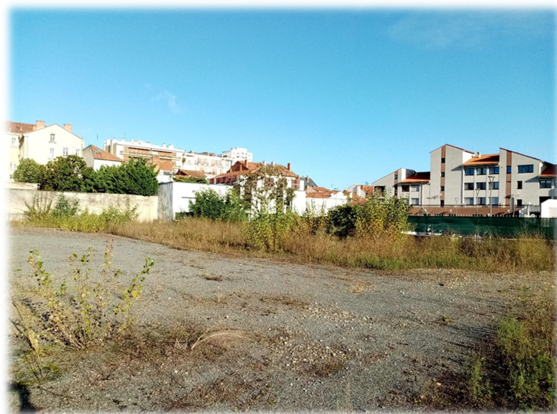
Prise de vue n°4 – Novembre 2021