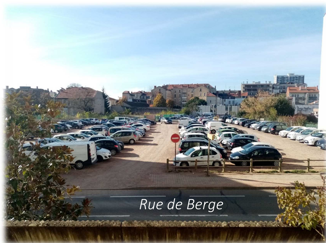
Prise de vue n°2 – Novembre 2021