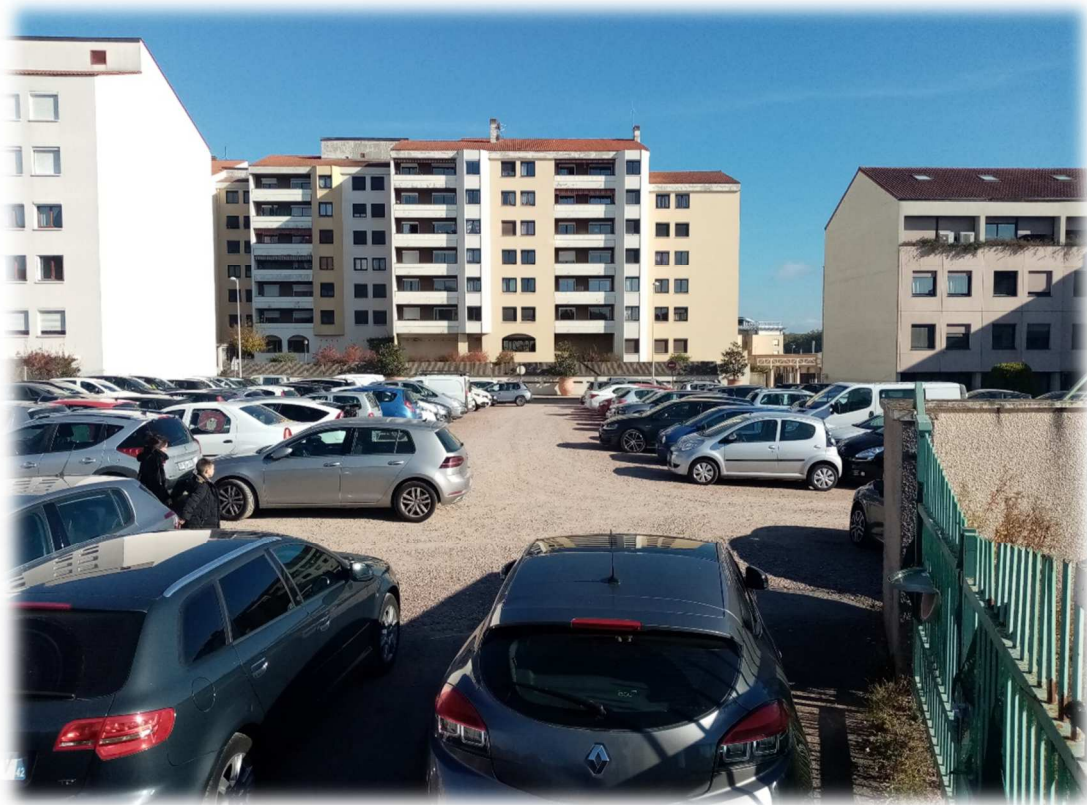
Prise de vue n°5 – Novembre 2021