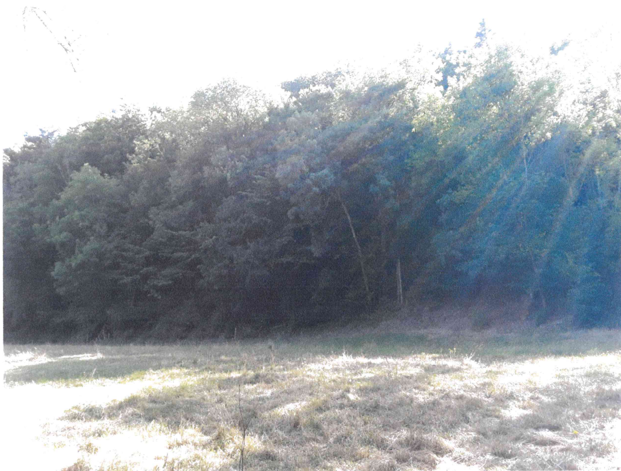
Vue de près – Photo 2