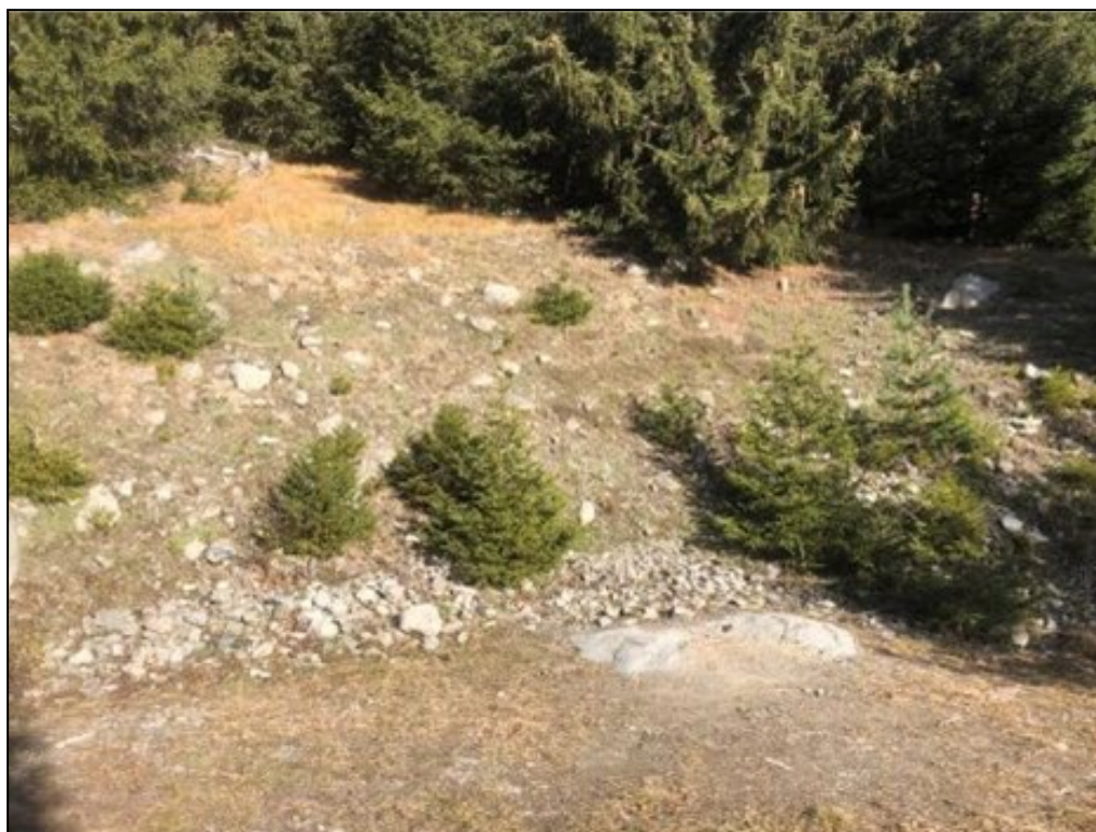
Zone d'implantation du dégraveur.