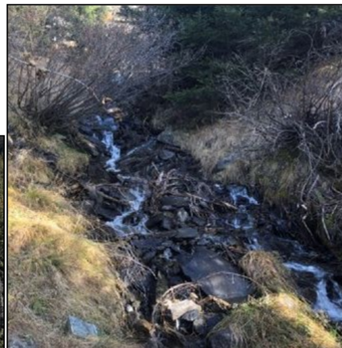
Vues vers les prises d'eau ouest, nord et est.