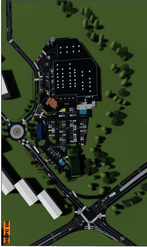
Avant, insertion paysagère vue aérienne

bbz BBZ ARCHITECTURE Alexandre Bonnassieux Architecte DPLG-043570 9 QUAI ULYSSE BESNARD 41000 BLOIS bbz-architecture.fr@wyze.digital