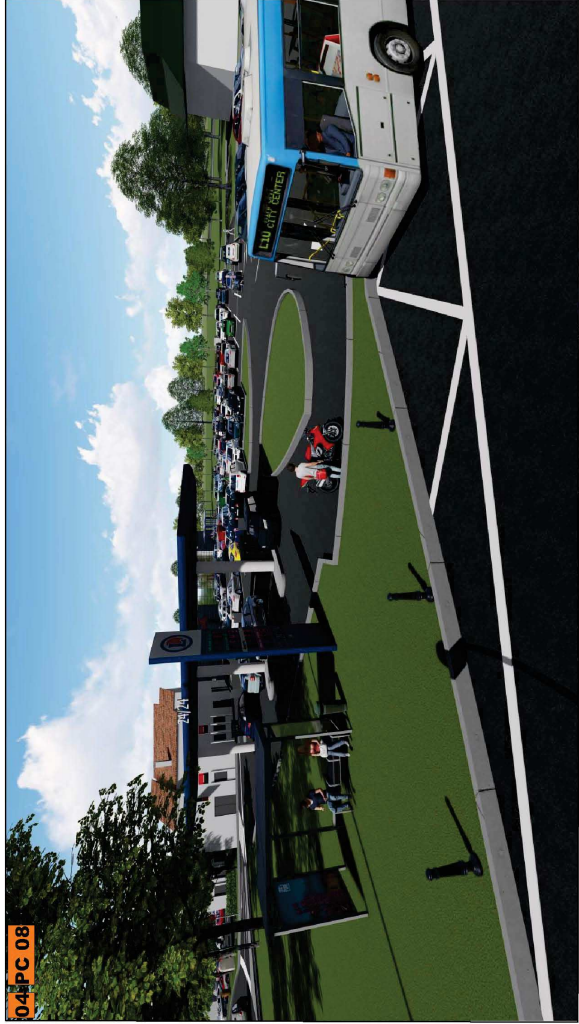
avant, Photographie dans le paysage lointain

bbz BBZ ARCHITECTURE Alexandre Bonnassieux Architecte DPLG-043570 9 QUAI ULYSSE BESNARD 41000 BLOIS bbz-architecture.fr@wyze.digital