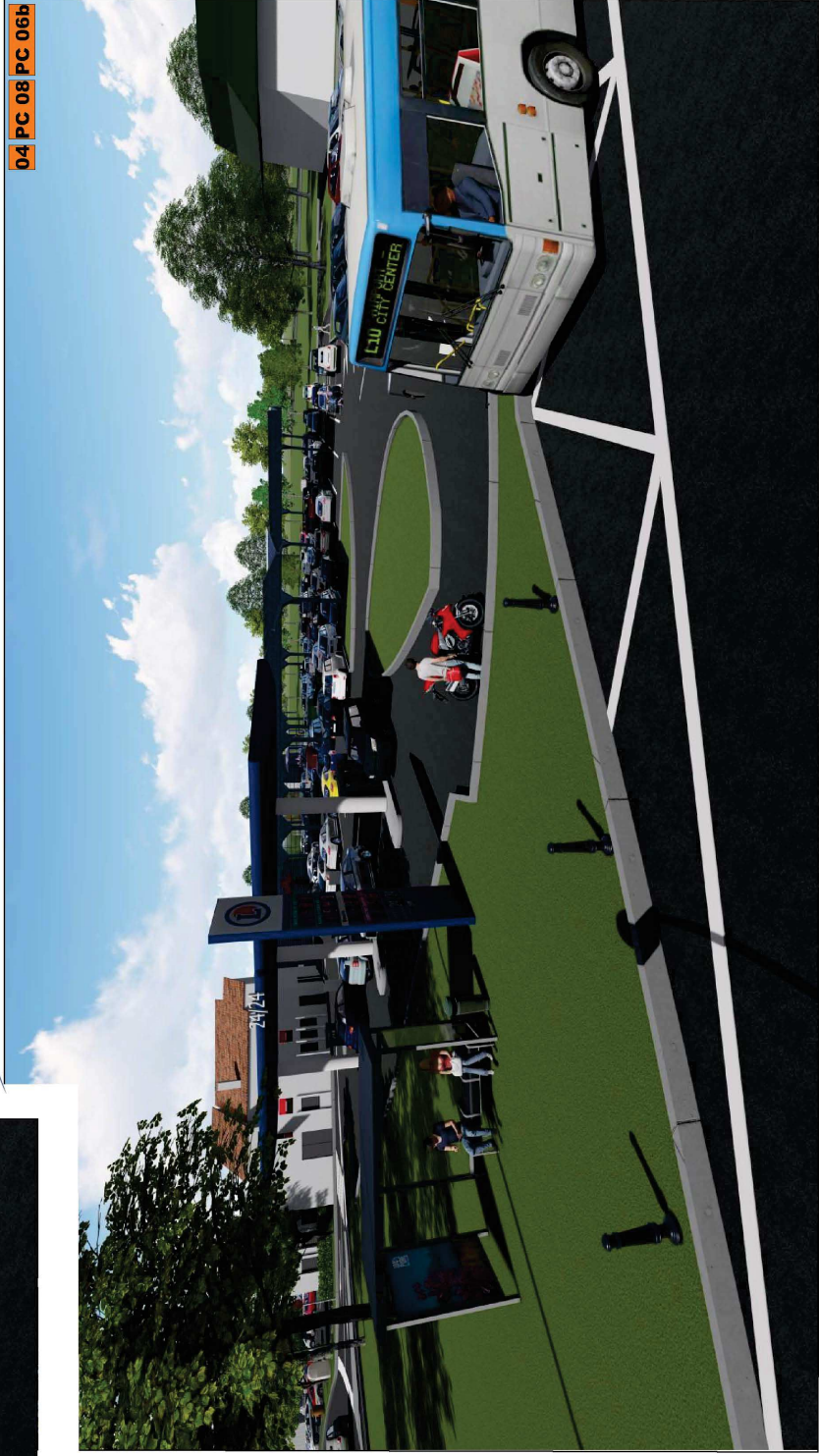
après, Insertion paysagère dans le paysage lointain

bbz BBZ ARCHITECTURE Alexandre Bonnassieux Architecte DPLG-043570 9 QUAI ULYSSE BESNARD 41000 BLOIS bbz-architecture.fr@wyze.digital