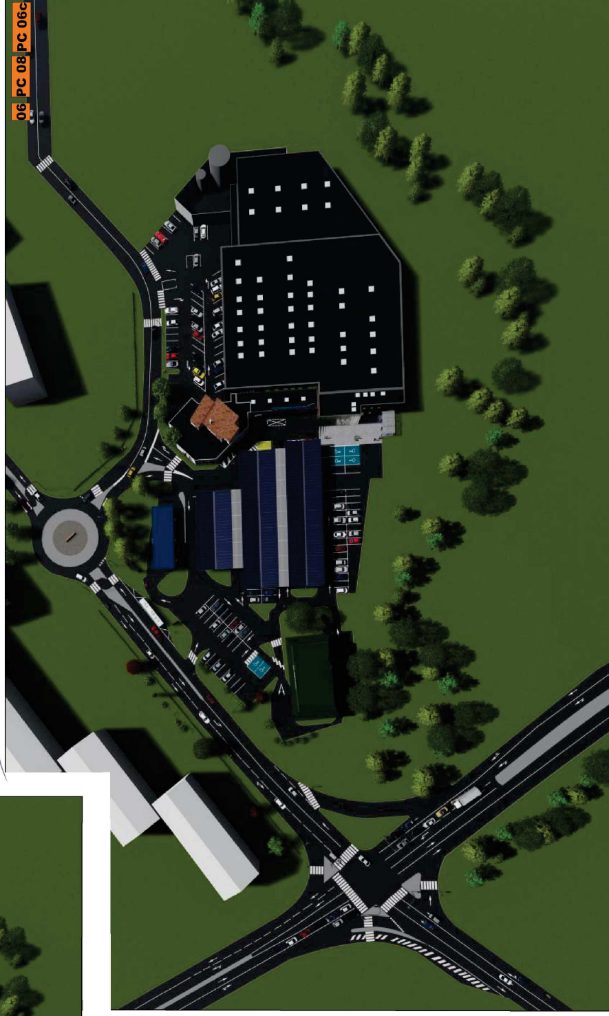
Après, insertion paysagère vue aérienne

BBZ ARCHITECTURE Alexandre Bonnassieux Architecte DPLG-043570 9 QUAI ULYSSE BESNARD 41000 BLOIS bbz-architecture.fr@wyze.digital