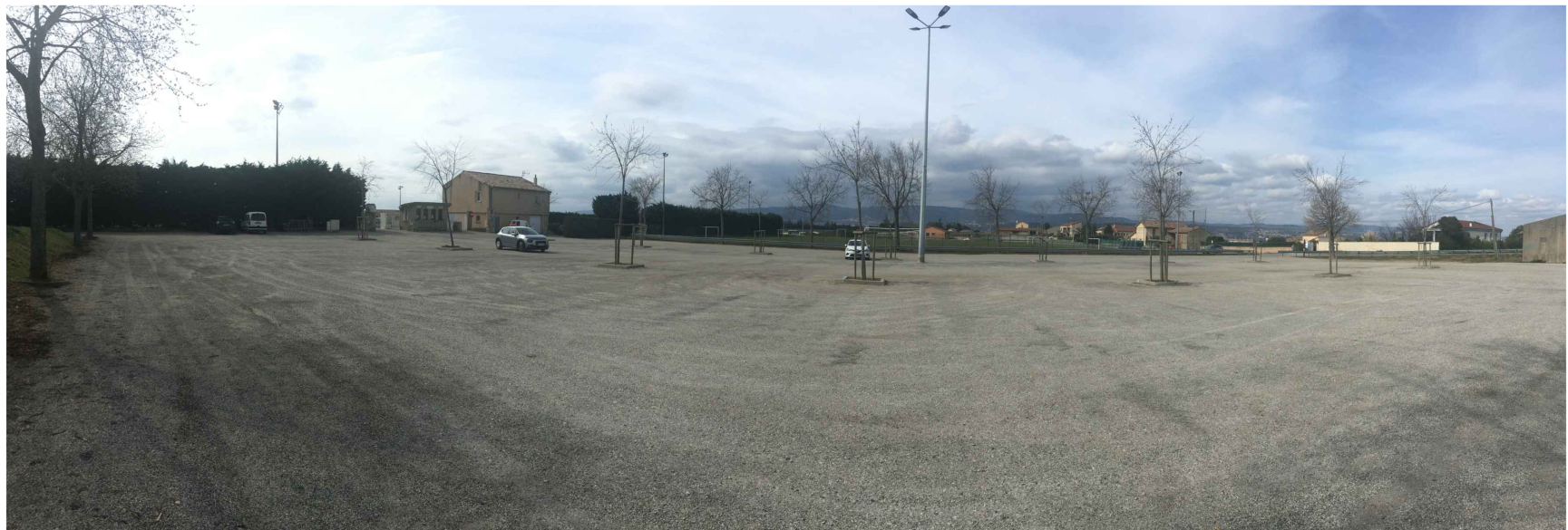
PC 7 b