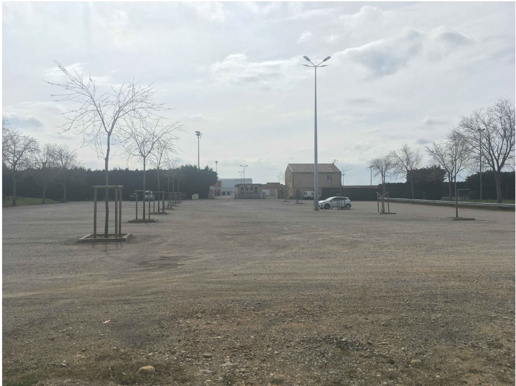
PC 7 a