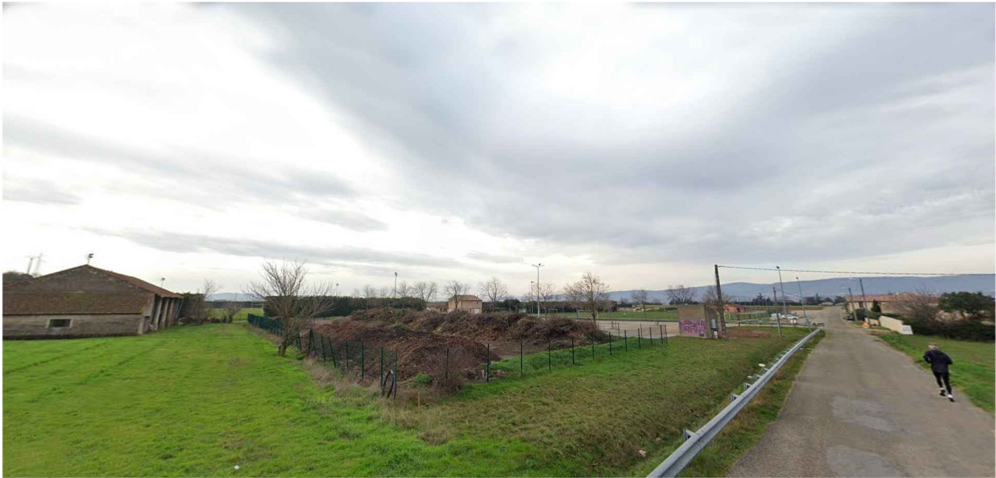
PC 8 a