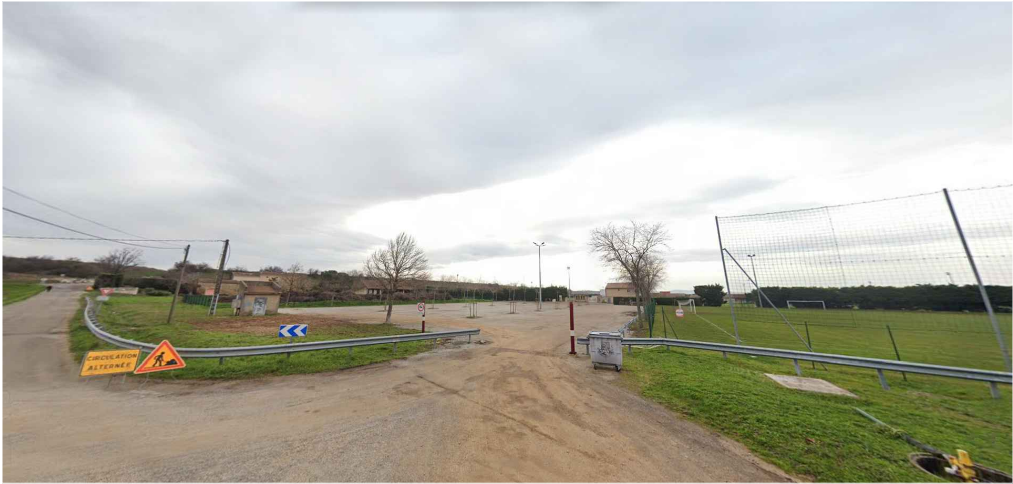
PC 8 b