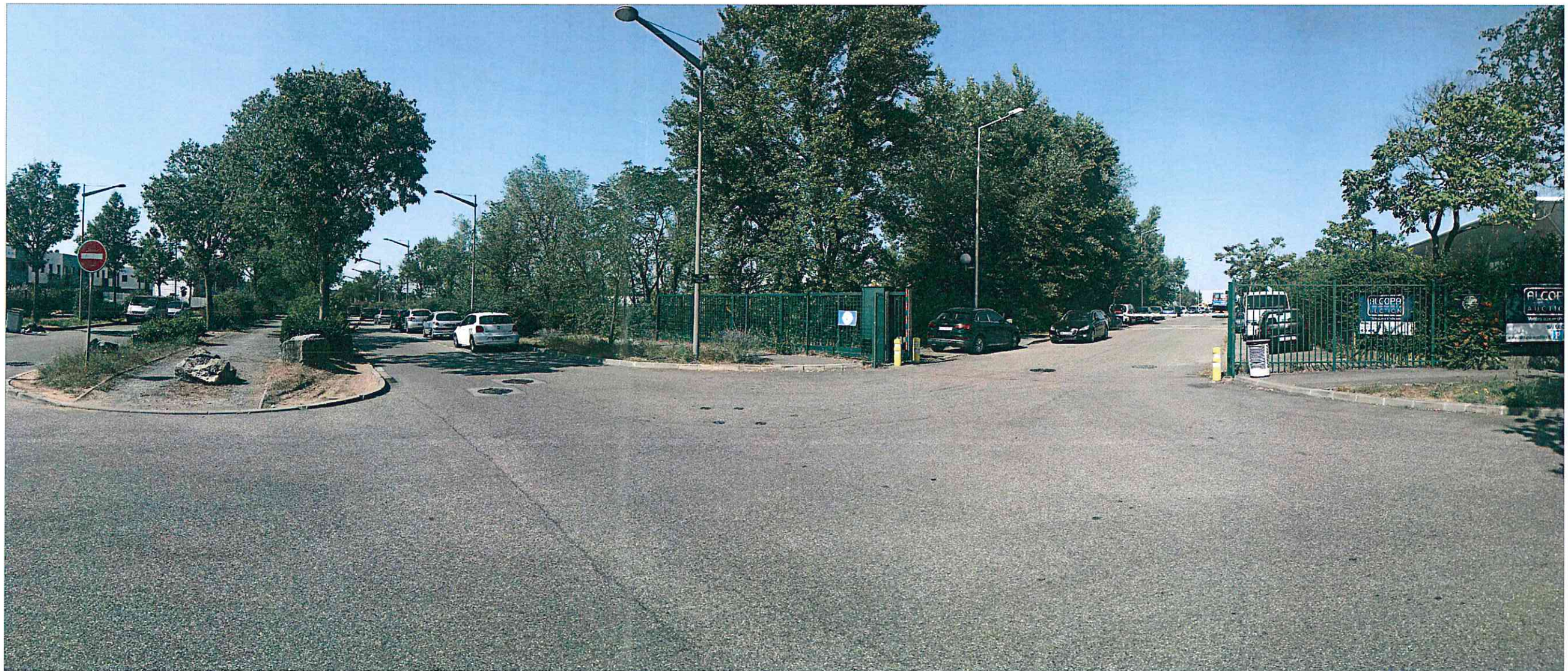
Photographie personnelle prise le 16/09/2019

y. architectes - 7 rue Basse Combalot - 69007 Lyon tel : 04 78 42 45 78 / fax : 04 37 66 56 30 agence@y-architectes.com