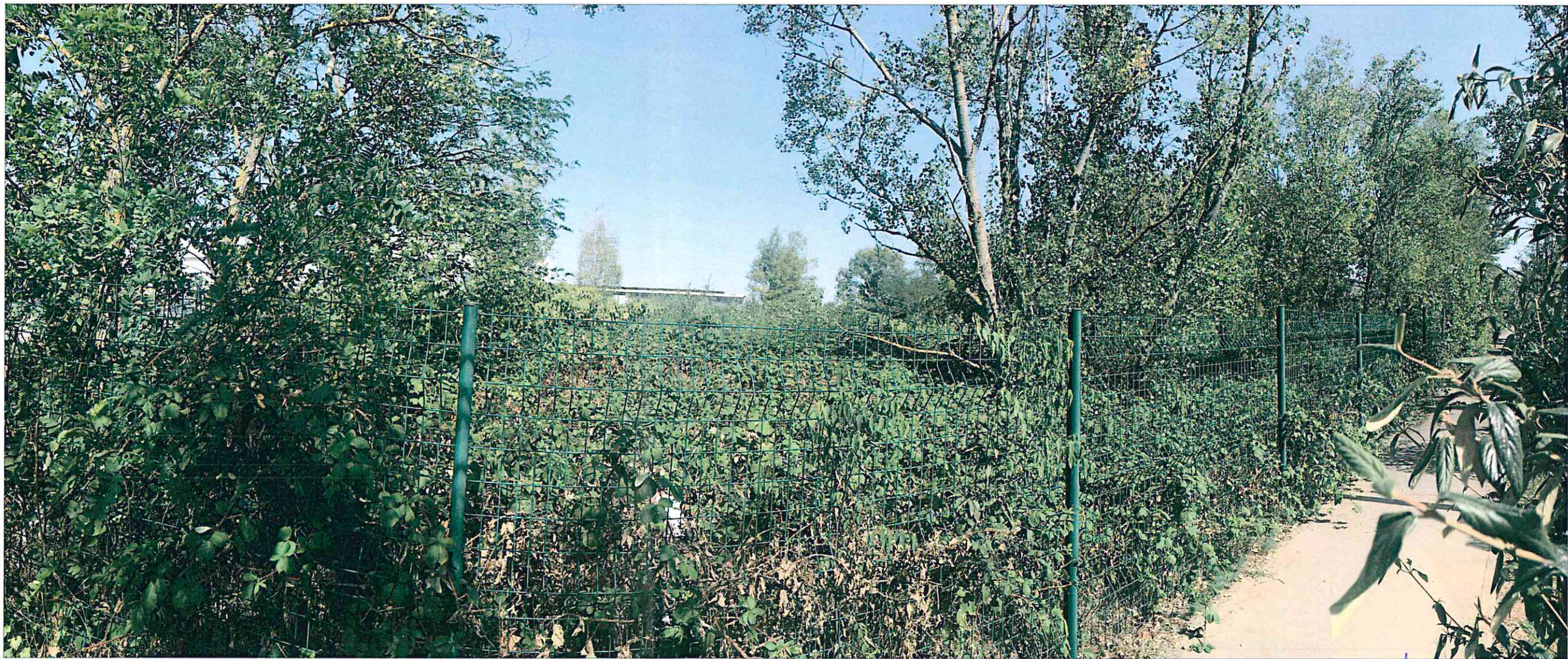
Photographie personnelle prise le 16/09/2019

SCBL 9 16, avenue Felix Faure 69007 SIREN 839 572 245