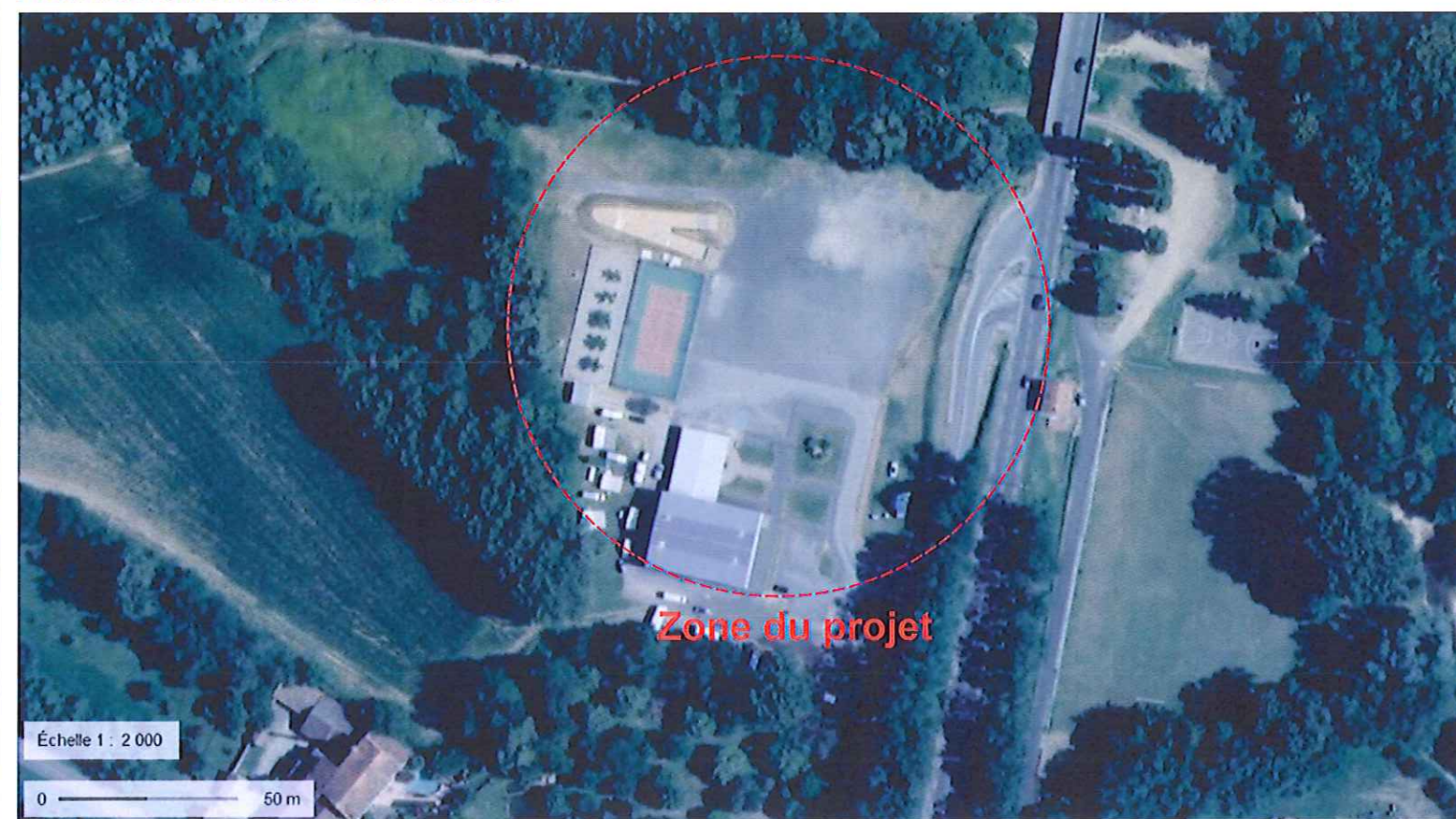
VUE AERIEENNE - Ech: 1/2000