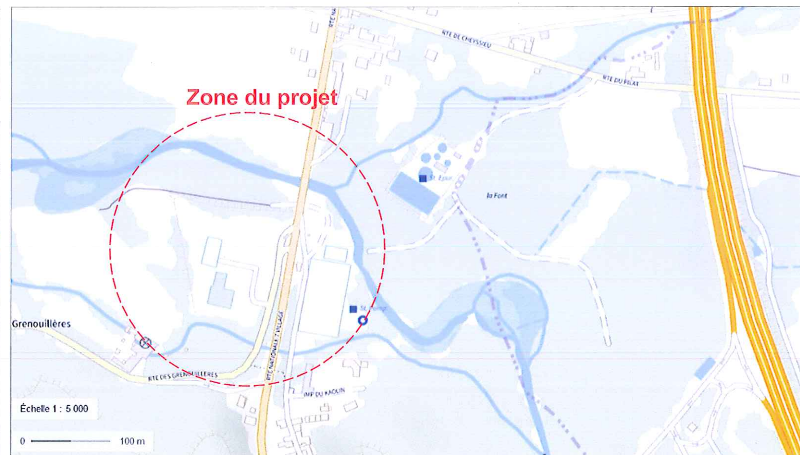
PLAN DE SITUATION - Ech : 1/5000

PAUL BÉDÉ ARCHITECTE D.P.G. 67 Grande Rue, 38160 St-Marcellin N° National de l'Ordre : 039764 N° SIRET : 347 799 694 00059