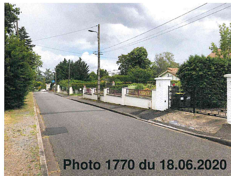
Photo 1770 du 18.06.2020