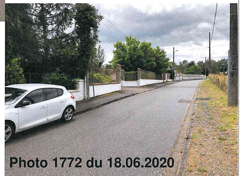
Photo 1772 du 18.06.2020