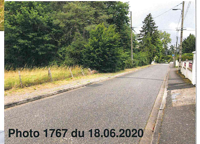
Photo 1767 du 18.06.2020