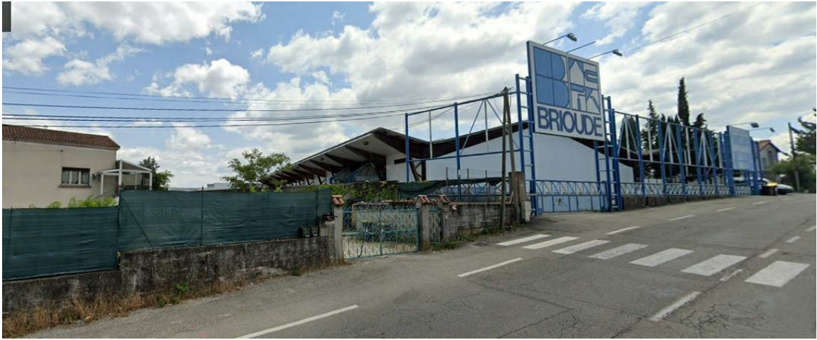
Vue 2 - Photographie lointaine