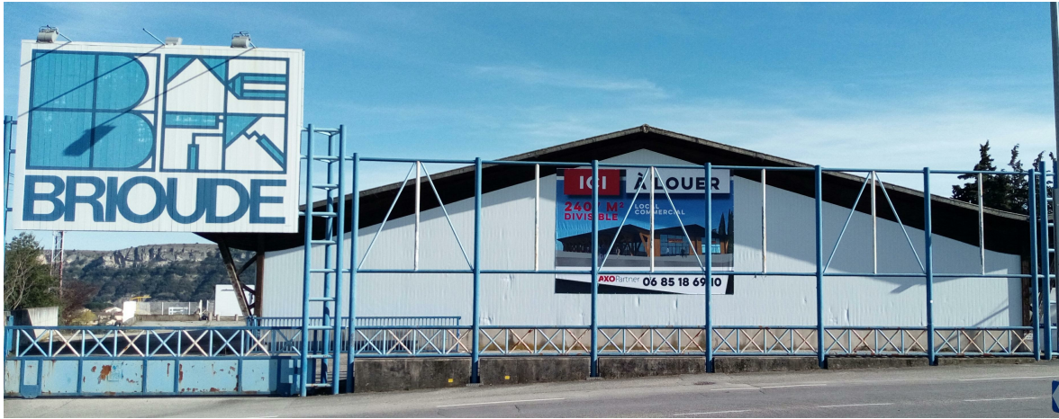
Vue 1 - Photographie proche

Ce document est uniquement destiné à la demande des autorisations d'urbanisme et ne peut être en aucun cas utilisé pour la réalisation de la construction.