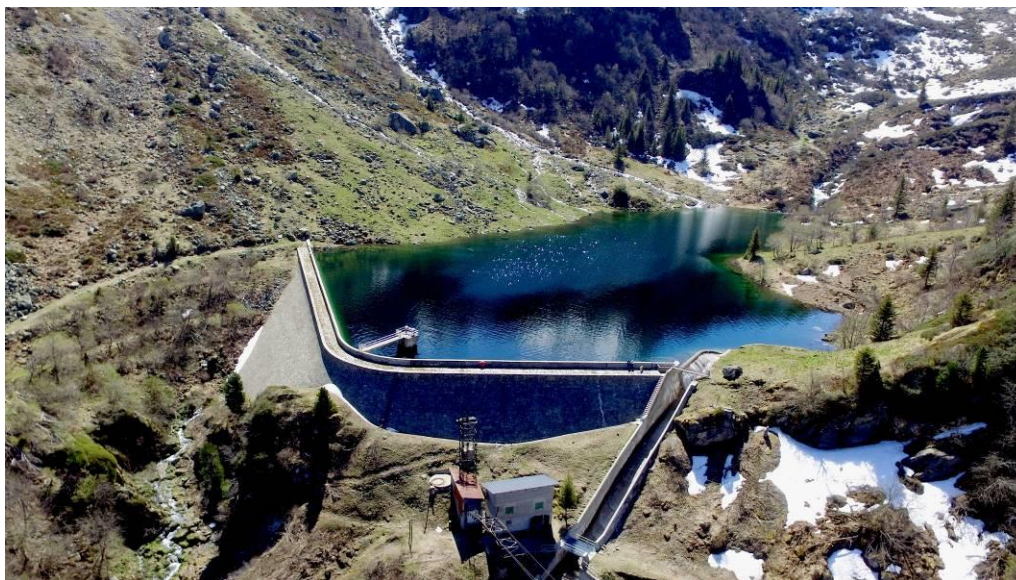
Vue du barrage du Carre – Lac de Périoule