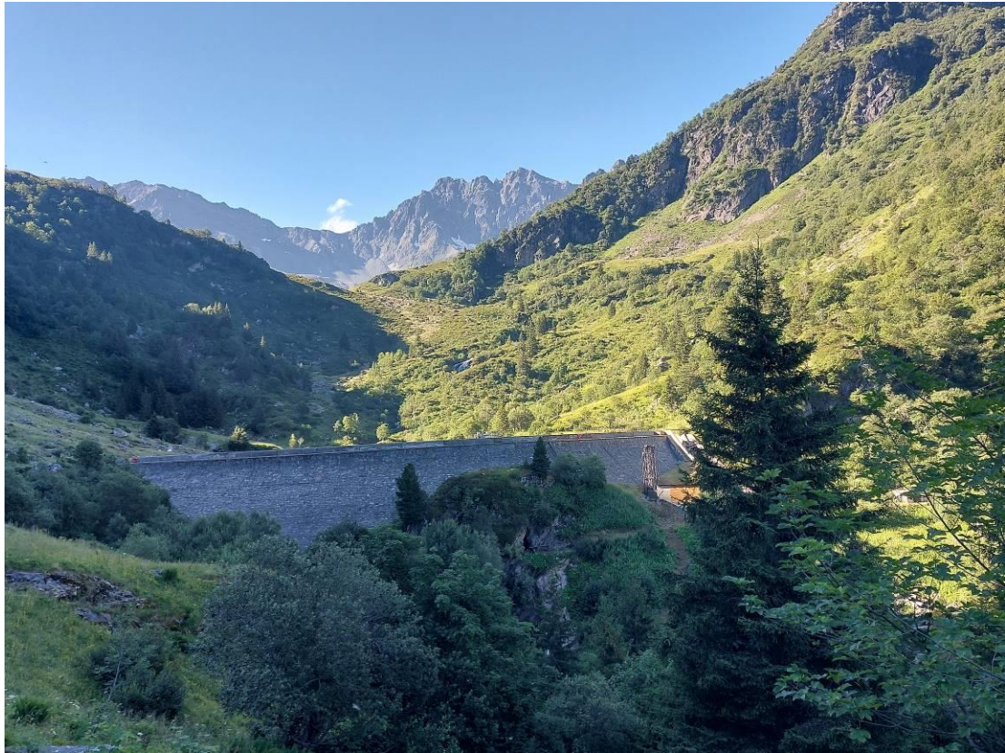
Bassin versant du Haut Veyton, depuis le barrage du Carre