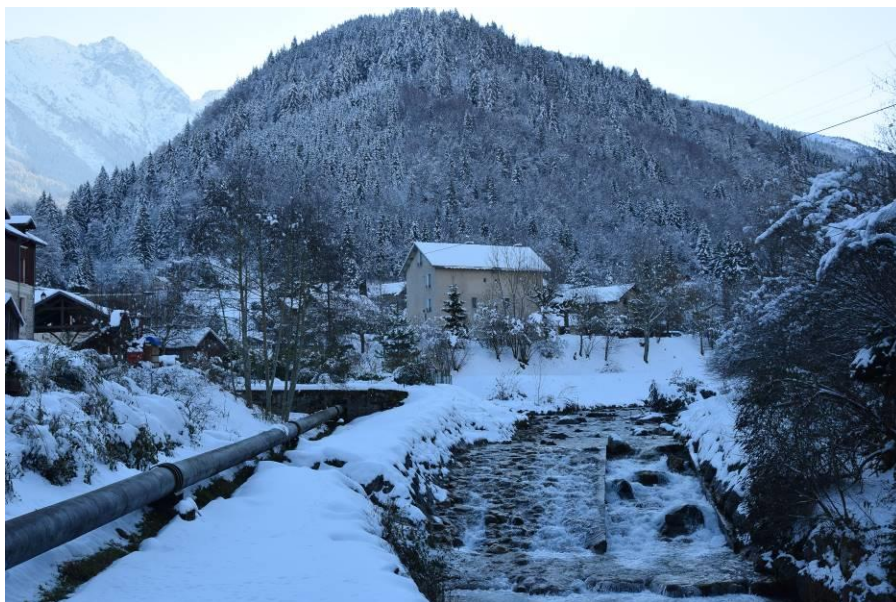
La conduite dans le bourg de Pinsot, sur sa partie aval, le long du Bréda