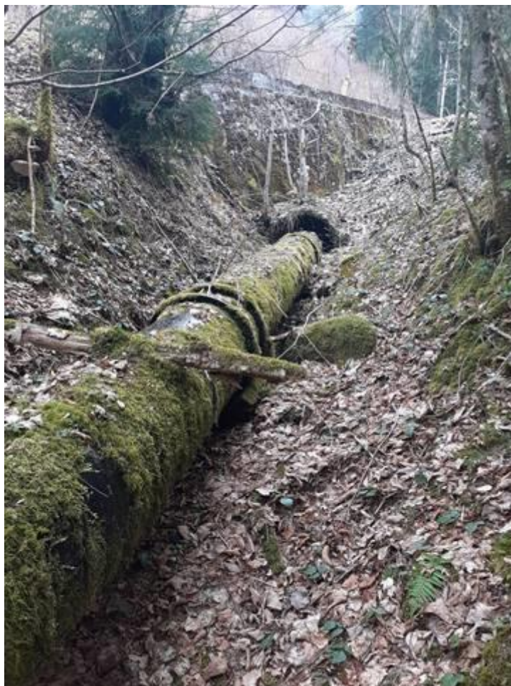
Conduite forcée existante; tronçon 1 au passage sous la route du Gleyzin