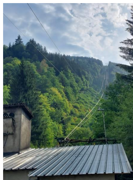
Vues du téléphérique et de la ligne électrique 20 kV