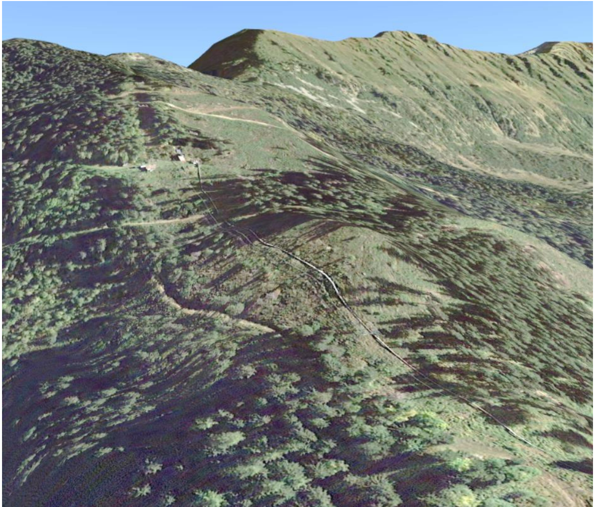
Vue aérienne de la partie amont