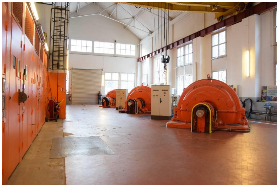
Les 3 groupes du Veyton dans la centrale de Pinsot