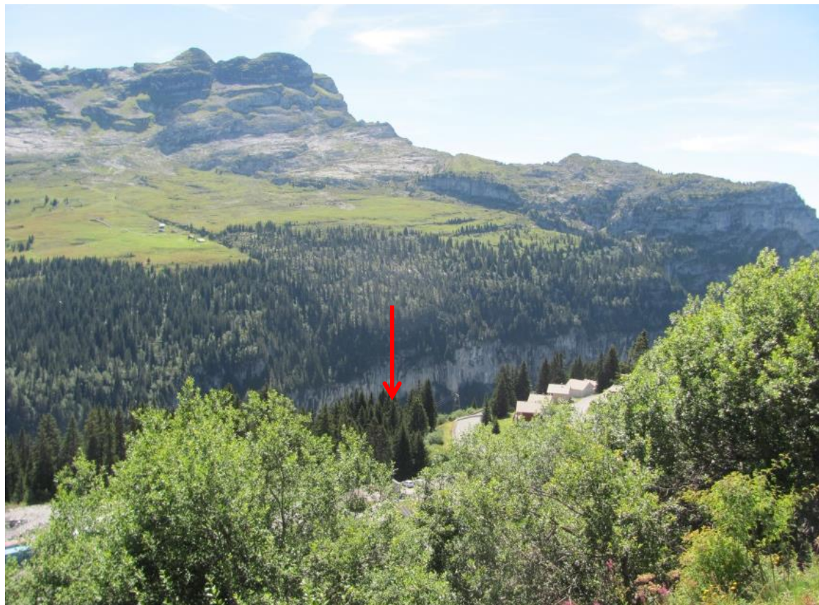
Un site isolé du reste de la station, pas perceptible (07/07/2017)