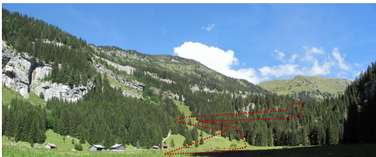
Le site de la plaine du lac (en rouge l'emprise du projet de circuit) (07/07/2017)