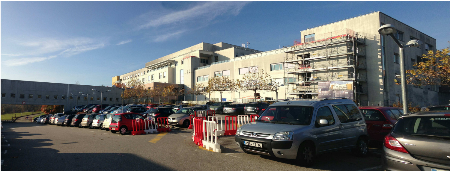
1 / Vue depuis le parking Est 3 sur le pôle mère enfant et la galerie logistique