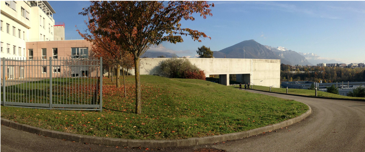
3 / Vue depuis la voie pompier sur la galerie logistique