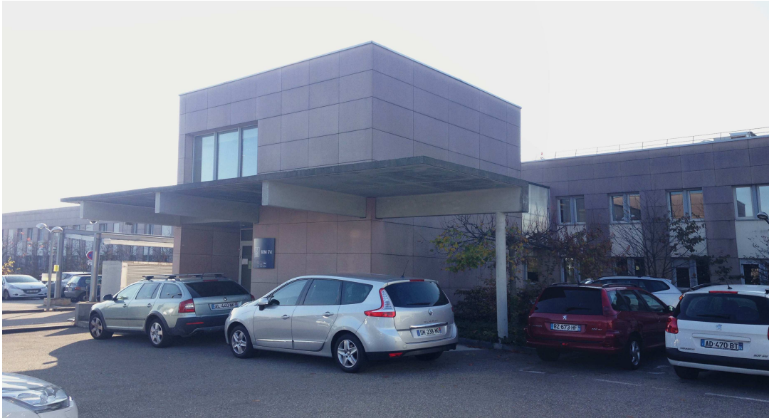
5 / Vue de l'entrée de l'IRM