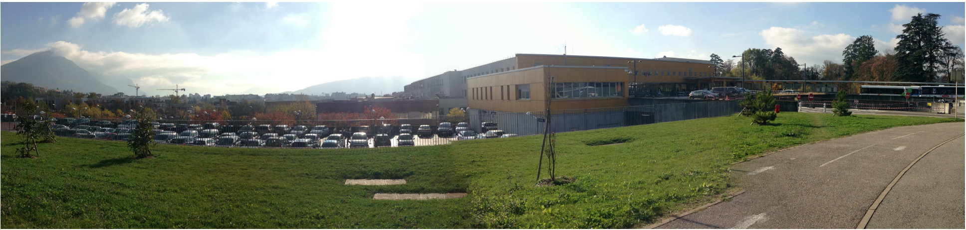
1 / Vue de l'entrée niveau principale 4 depuis le rond point