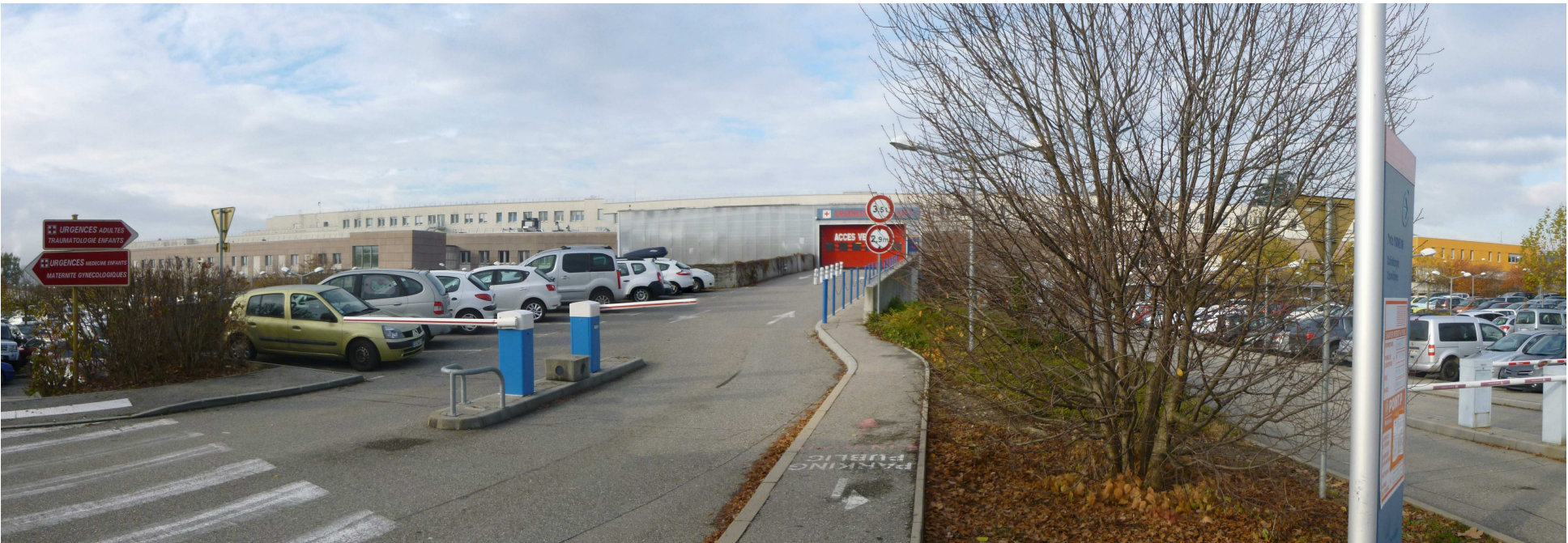
3 / Vue de l'entrée des Urgences et de la façade Est