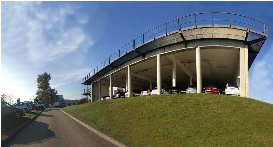
5 / Vue depuis l'entrée de la voie pompier sur l'hélistation