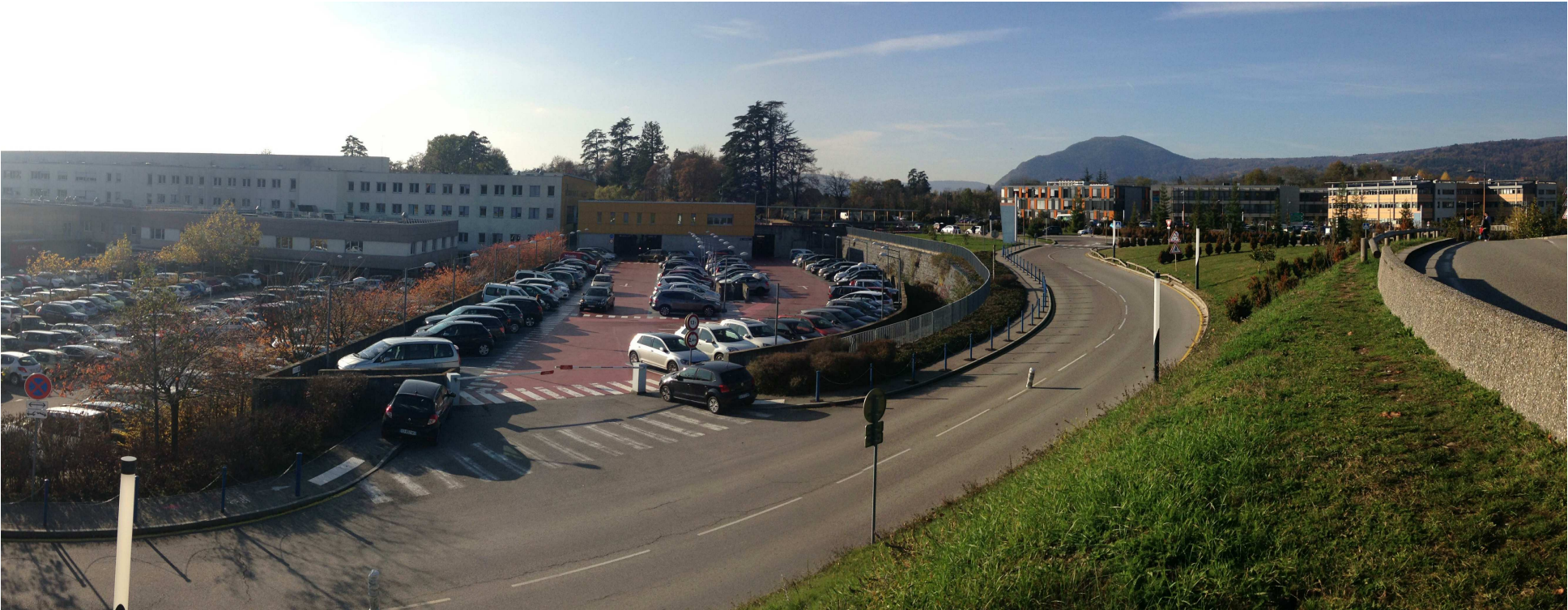
2 / Vue de l'entrée du parking Nord niveau 3 et du service de réanimation