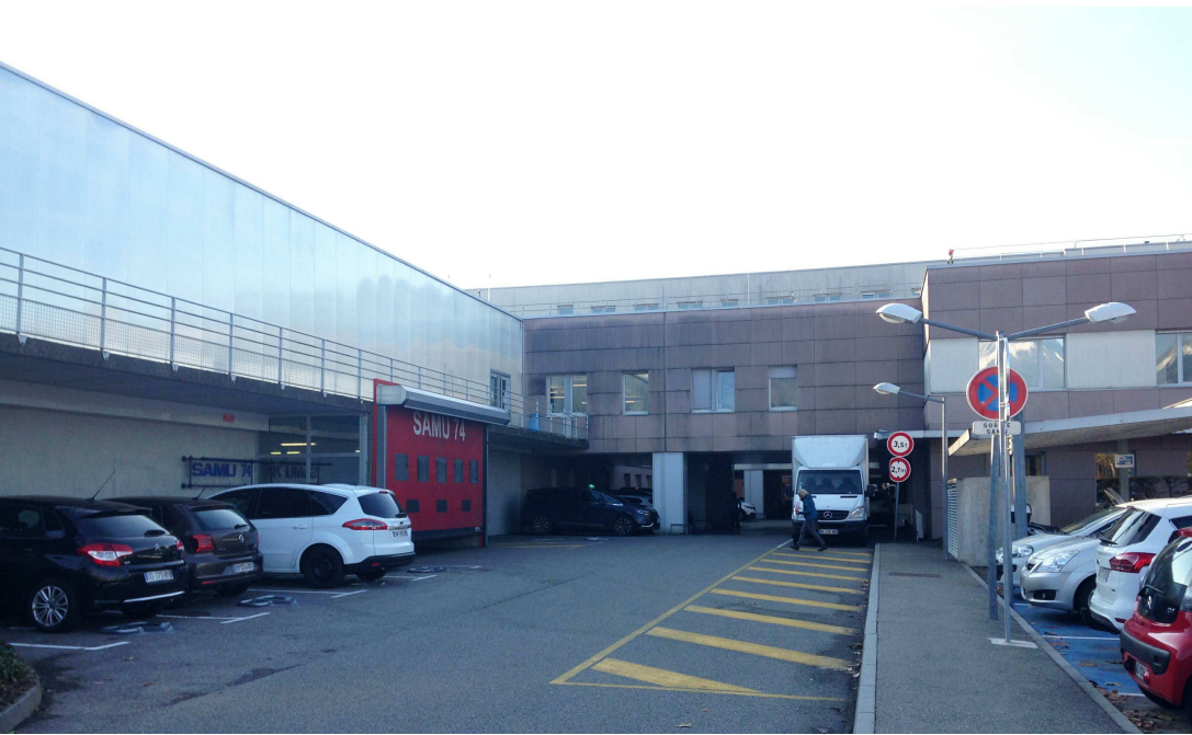
4 / Vue de l'entrée du SAMU, niveau 1