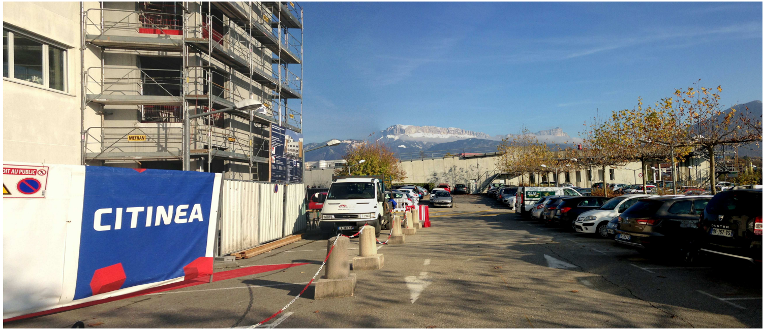
2 / Vue depuis le parking Est 3 sur l'hélistation