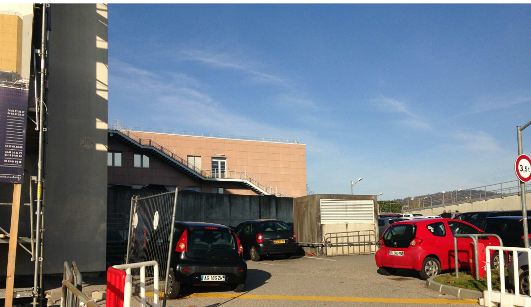
4 / Vue depuis le parking Est 3 sur le bloc central opératoire