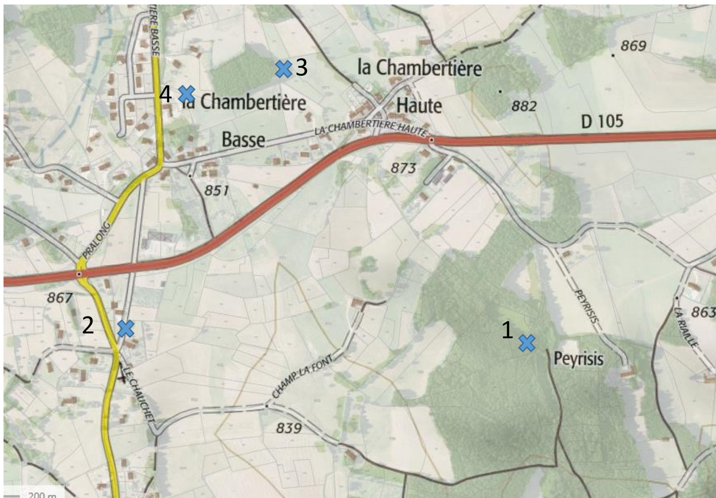
Localisation cartographique des prises de vues.