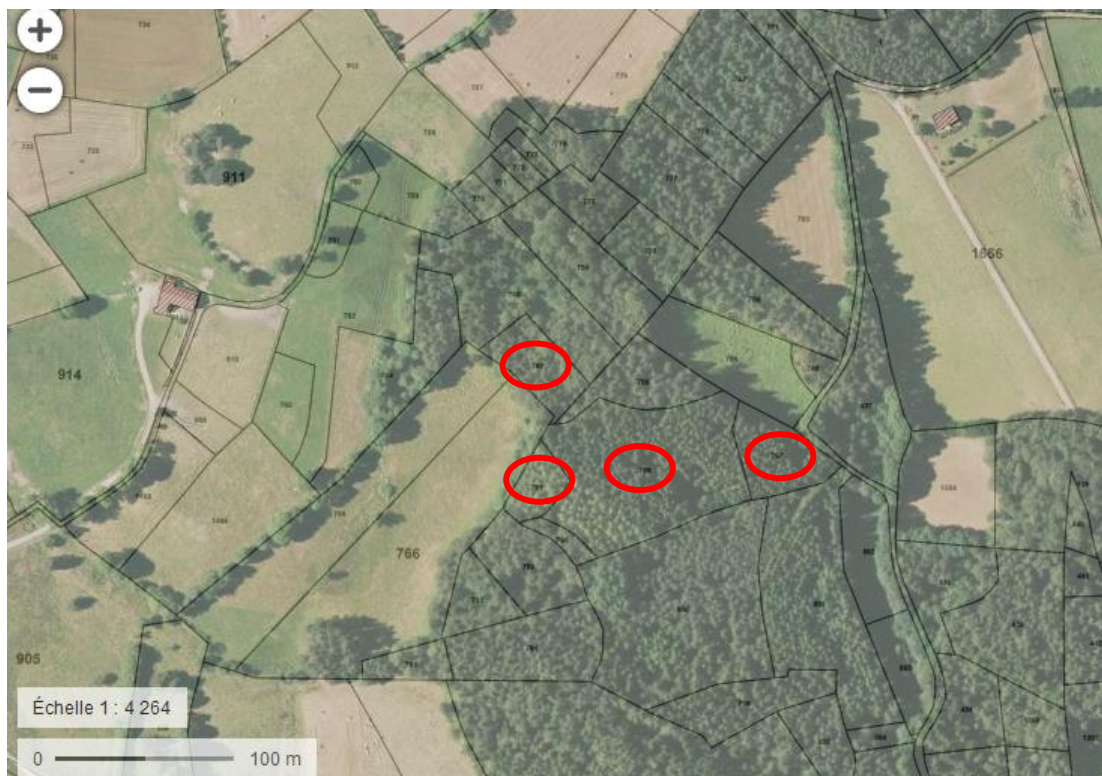
Annexe 6 : aucune zone Natura 2000 à proximité