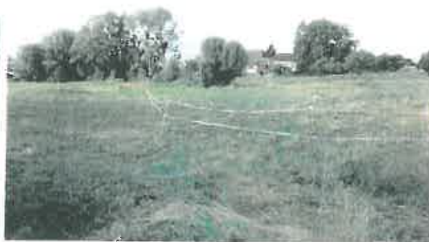
Vue des parcelles concernées par le projet, en direction du Sud-Ouest Ilot d'arbres qui seront conservés - Corps de ferme qui sera réhabilité (à droite)