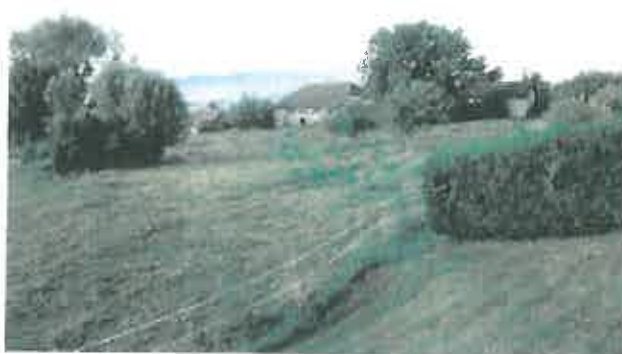
Corps de ferme qui sera réhabilité Vue en direction du Sud-Ouest