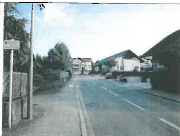
Route de Promery Vue en direction du Nord