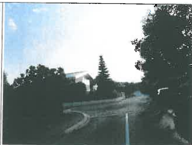
Rue des Grands Champs Vu en direction du Nord-Est