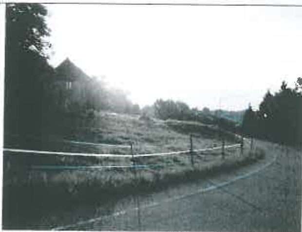
Corps de ferme des parcelles n°22 et 26 – Section AD – Vue en direction du Sud-Est