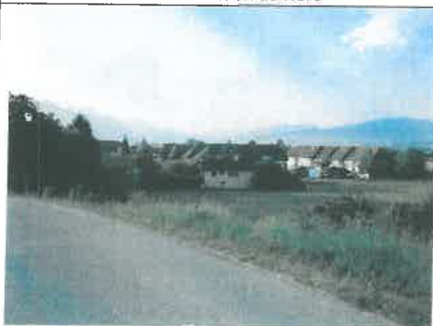
Vue depuis le chemin de la Tour en direction du Sud : vue sur le terrain du programme immobilier voisin en cours de réalisation