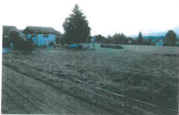
Partie Est des parcelles concernées par le projet Vue en direction du Sud-Est