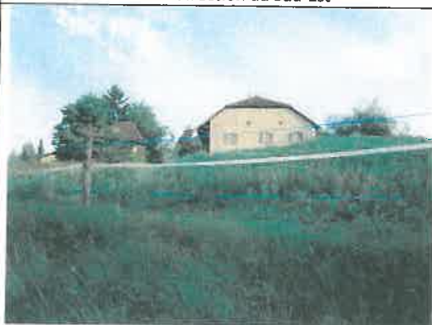
Corps de ferme des parcelles n°22 et 26 – Section AD – Vue depuis le chemin de la Tour en direction du Nord