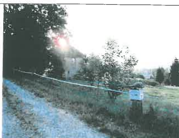
Corps de ferme des parcelles n°22 et 26 – Section AD – Vue en direction de l'Est