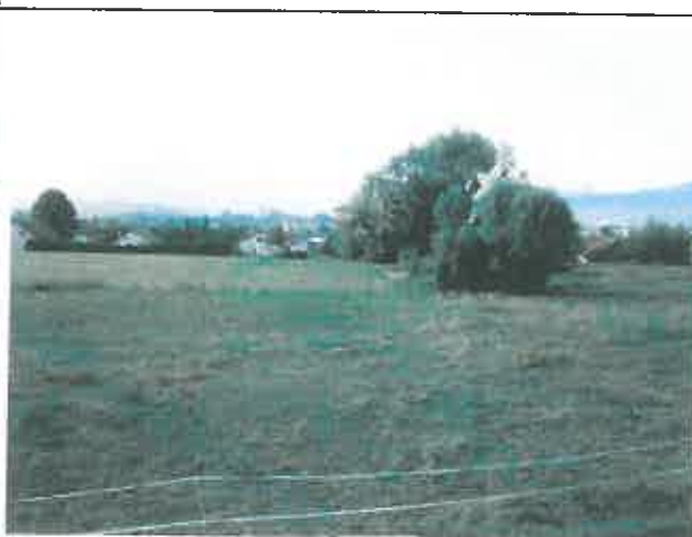
Ilot d'arbres qui seront conservés Vue en direction du Sud