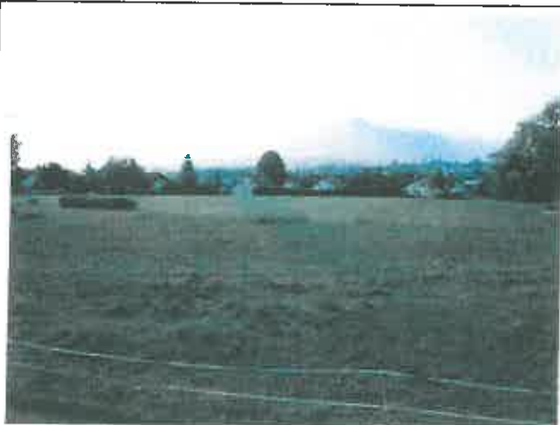
Vue des parcelles concernées par le projet, en direction du Sud