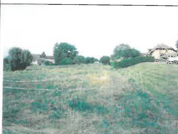
Partie Nord-Ouest du projet (parcelle clôturée) Vue en direction de l'Ouest