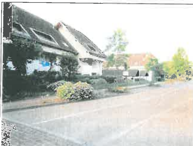
Rue des Grands Champs Vu en direction du Sud-Ouest