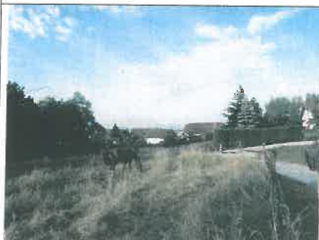
Angle Nord du projet (parcelle clôturée) Vue en direction de l'Ouest