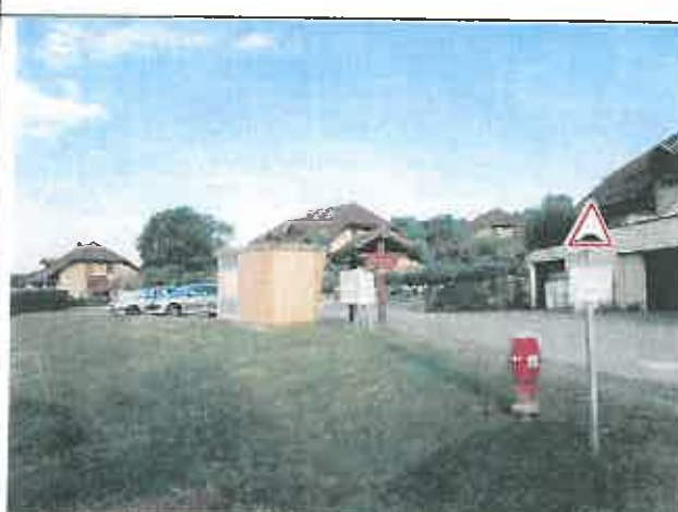
Hameau au Nord du projet Vue en direction du Nord-Ouest