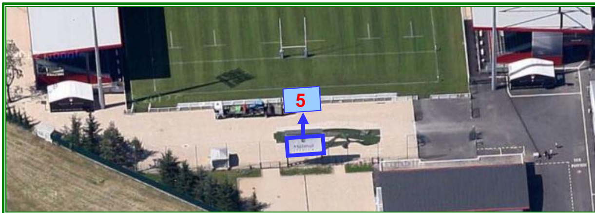
Figure 2 : Modification prévue pour l'extension du MATMUT STADIUM (vue depuis le sud)