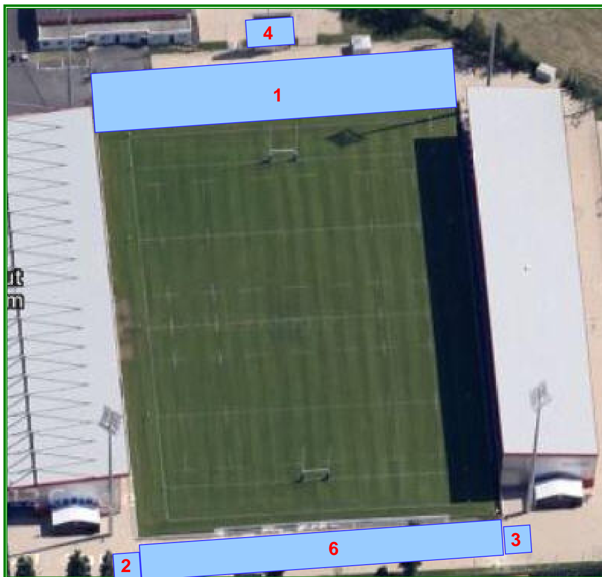
Figure 3 : Constructions prévues pour l'extension du MATMUT STADIUM (vue depuis le nord)