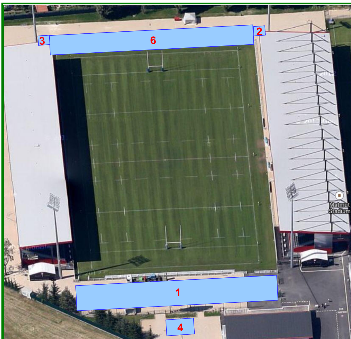
Figure 1 : Constructions prévues pour l'extension du MATMUT STADIUM (vue depuis le sud)