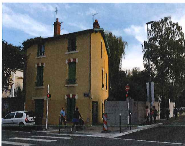
VUE DEPUIS LE BOULEVARD COTE BLATIN