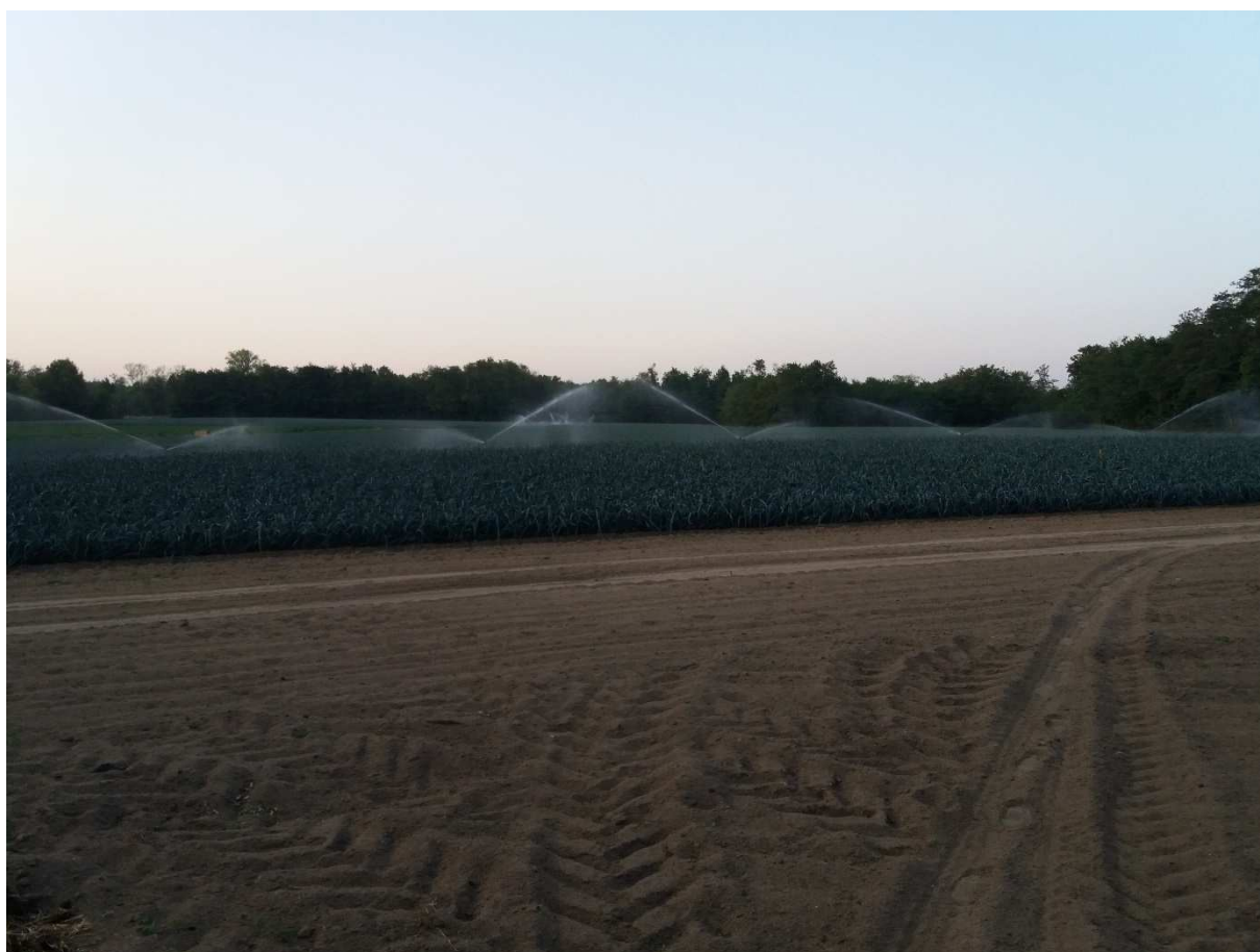
2) Vue vers le Nord depuis le secteur où sera implanté le forage en direction du Nord et du forage existant (photographie du 4 août 2020)