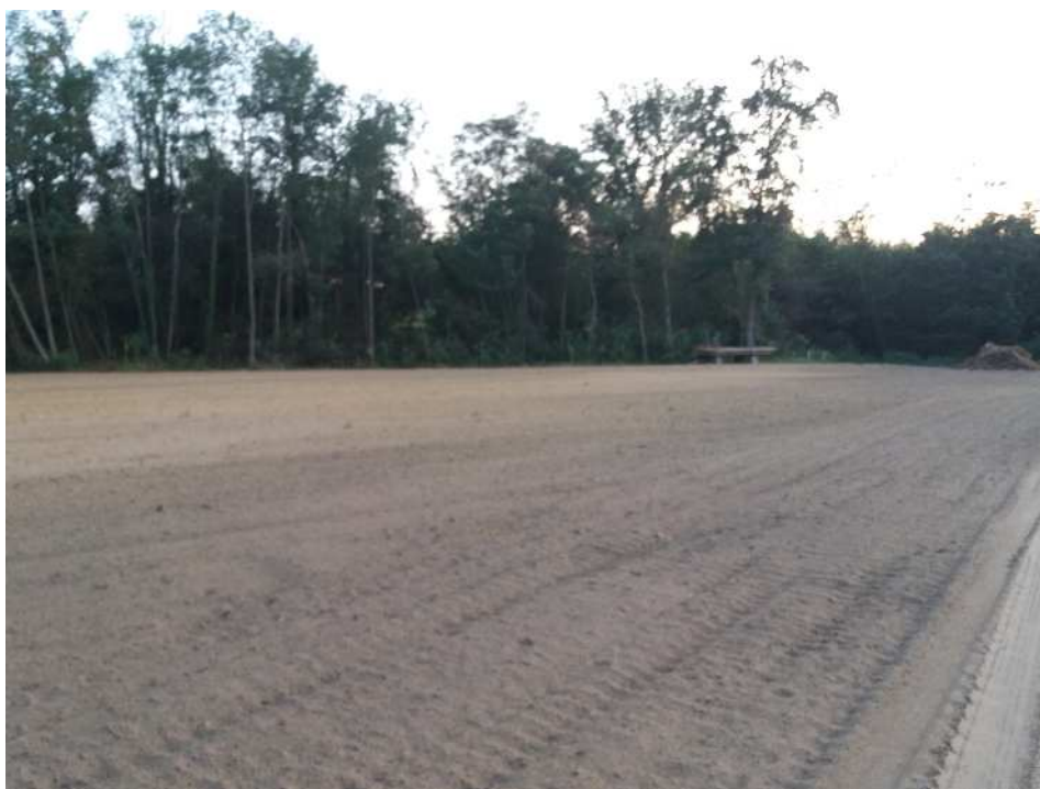
1) Vue vers le Sud sur la parcelle où sera implanté le forage, (photographie du 4 août 2020)

Annexe 3 : photographies datées de la zone d'implantation.