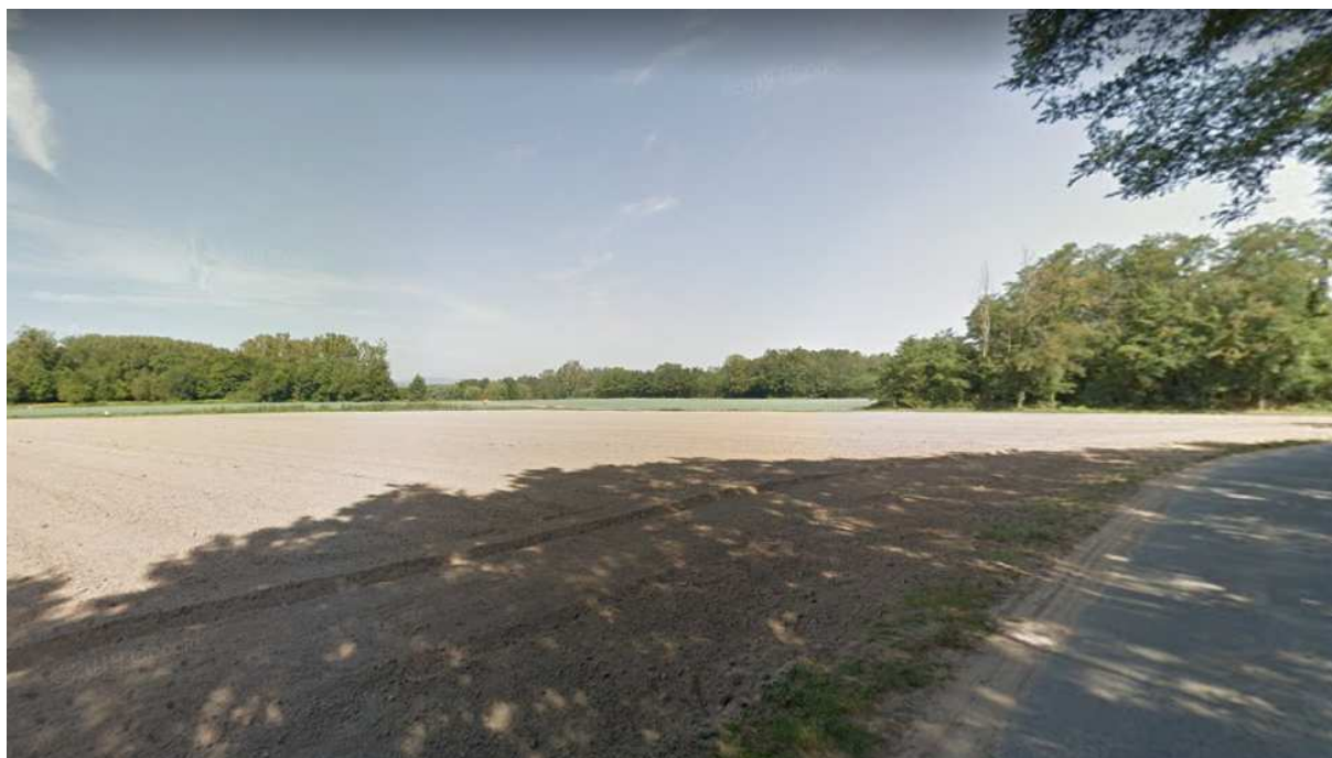
3) Vue depuis le chemin bordant les en direction du projet vers le Nord du secteur autour du forage actuel (streetview aout 2013)