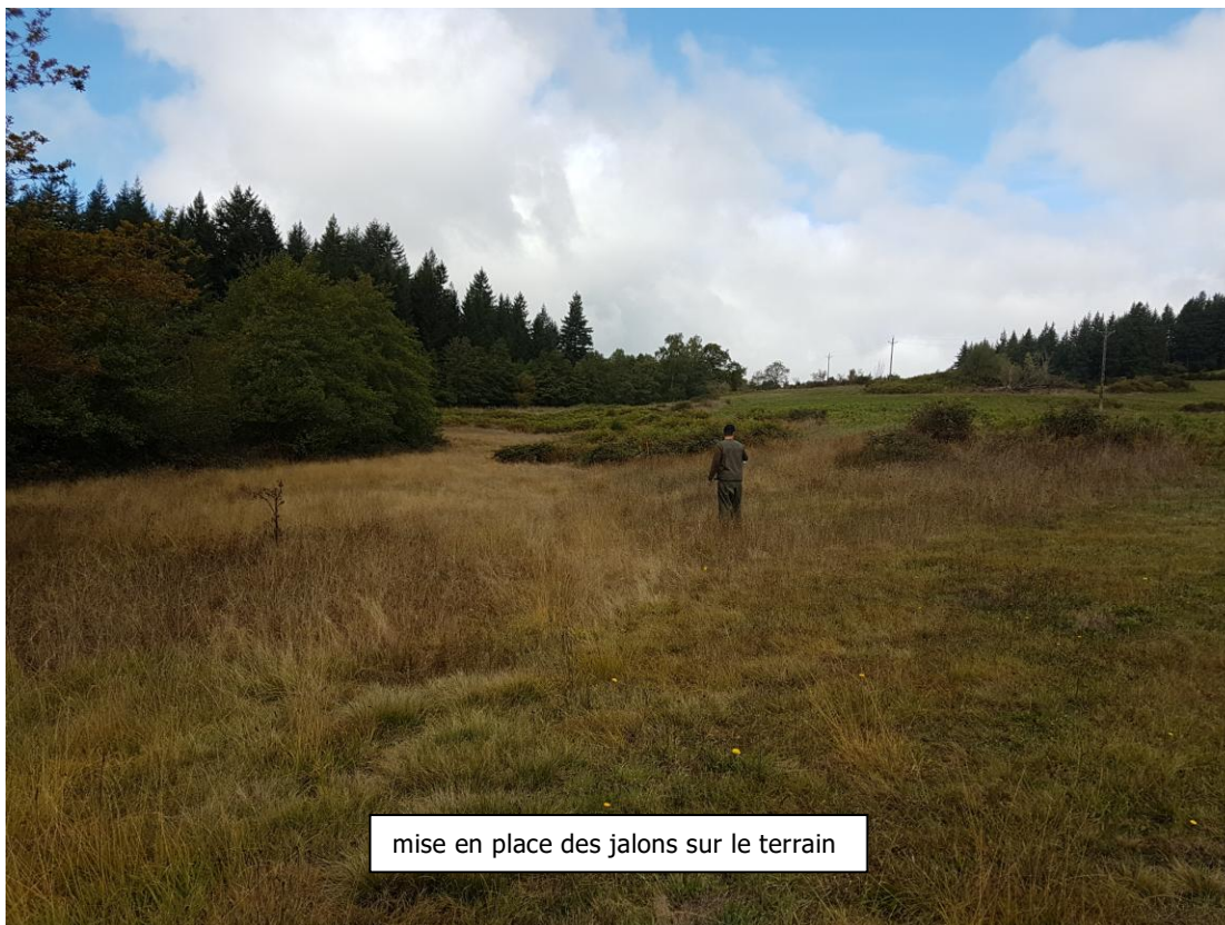
mise en place des jalons sur le terrain