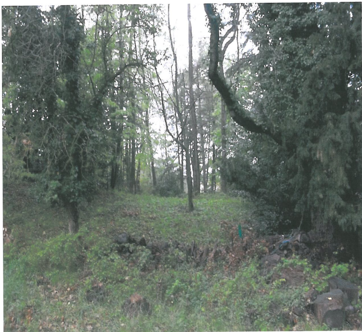
Point de vue 2 lointain