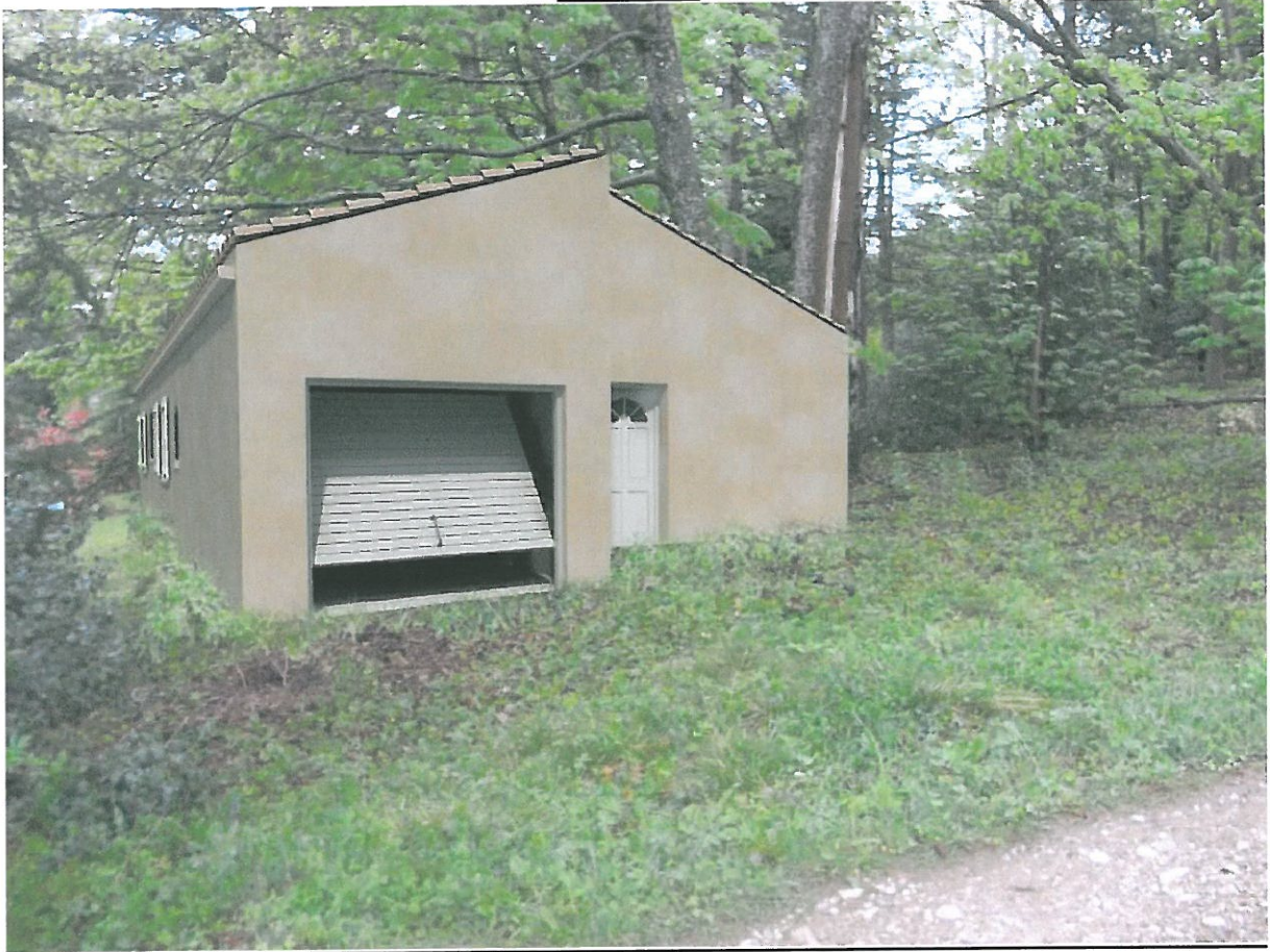
Point de vue 2 proche