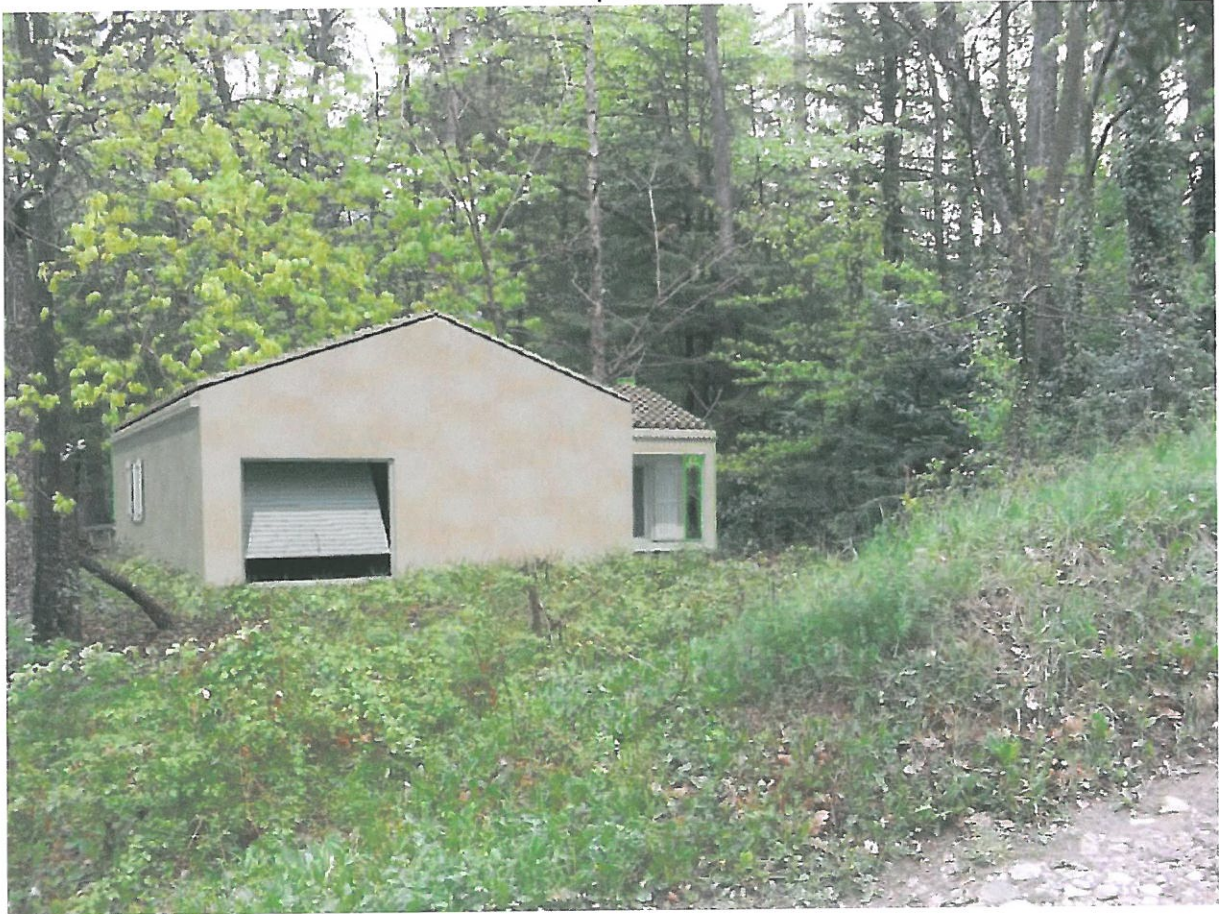
Point de vue 1 Proche