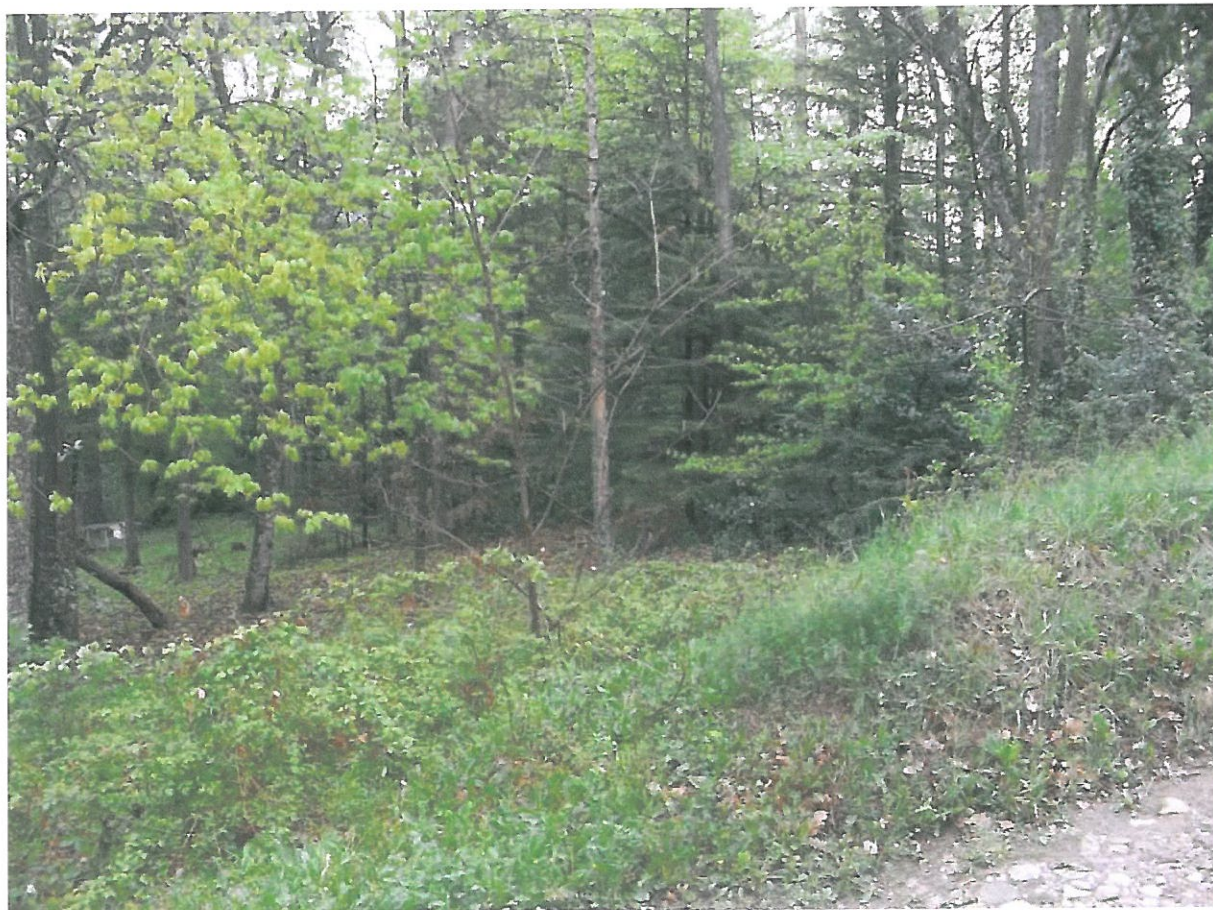
Point de vue 1 lointain