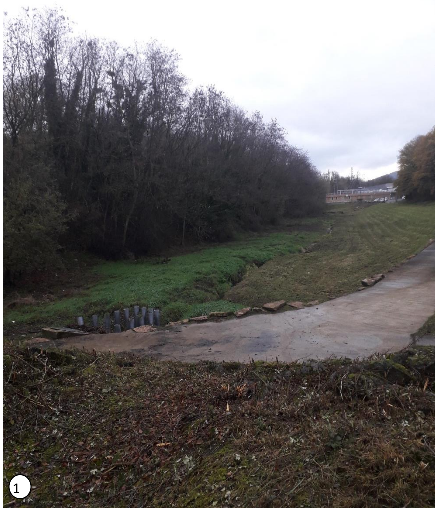
Figure 2 : Vue du bassin du haut de l'ouvrage hydraulique (décembre 2020)