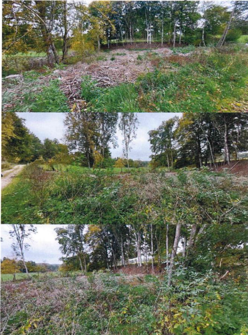
et B1095 - 1.50ha Boisement Libre à Reconquérir