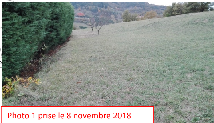
Photo 1 prise le 8 novembre 2018