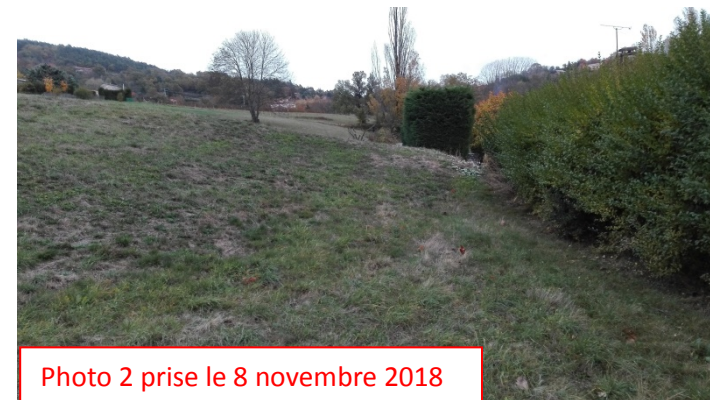
Photo 2 prise le 8 novembre 2018