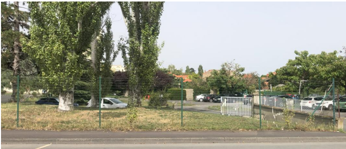
CLOTURE EXISTANTE (grillage Ht. 2m)