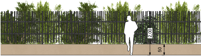
CLOTURE PROJET (Muret 0.50 m+ Grille barreaudée 1.50 m; Ht totale 2,00 m) + haie