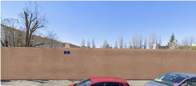
CLOTURE EXISTANTE (Mur enduit Ht: 3 m)