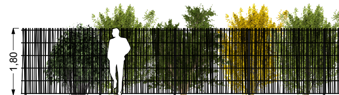
CLOTURE PROJET treillis soudé type Oobamboo RAL gris, Ht: 1.80 m