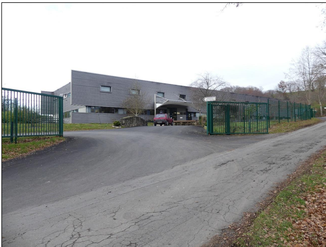
Vue 5 : Vue de l'accès au site INTERLAB depuis sa limite Sud