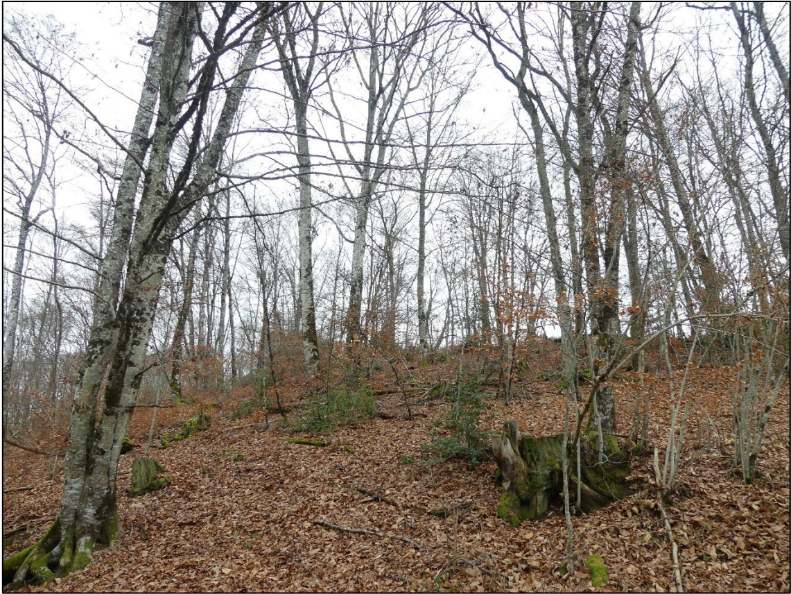
Vue 7 : Vue des boisements de l'extension [ym1]