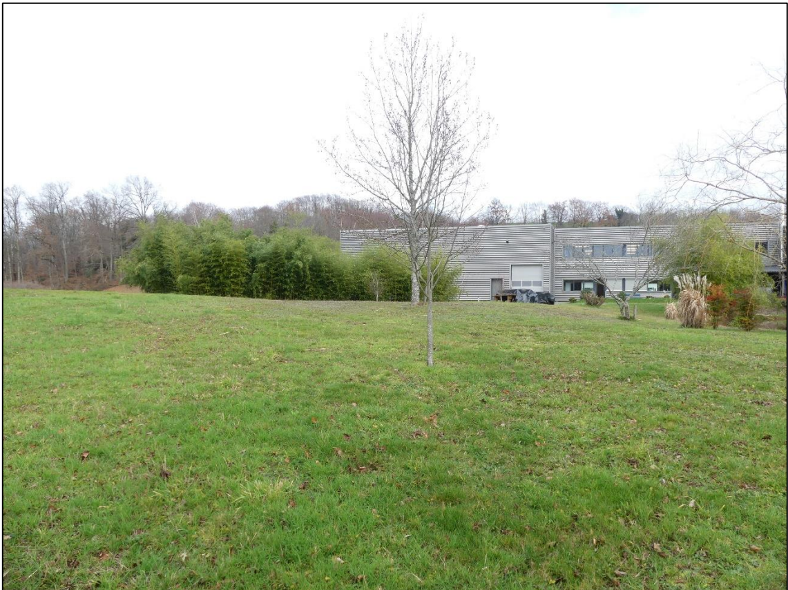
Vue 4 : Vue du site INTERLAB depuis sa limite Ouest