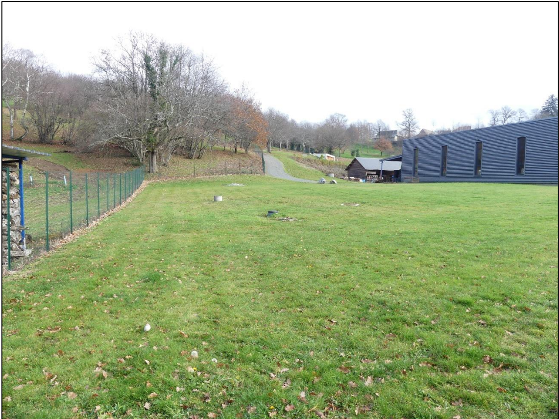
Vue 2 : Vue du Nord du site INTERLAB