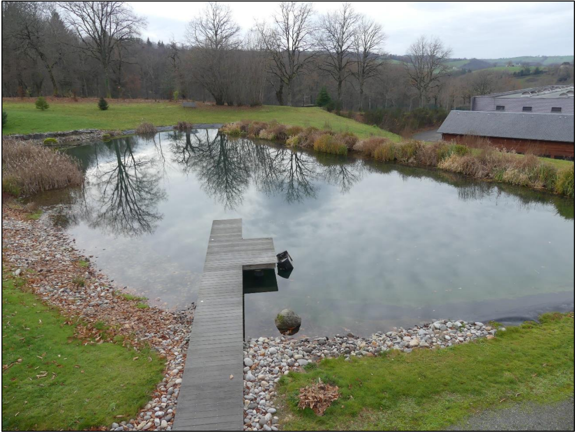
Vue 1 : Vue du site INTERLAB et du bassin d'agrément