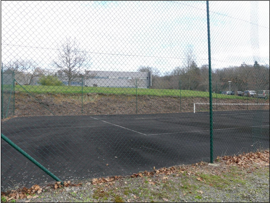
Vue 3 : Vue du terrain de tennis et des environs Ouest du site INTERLAB