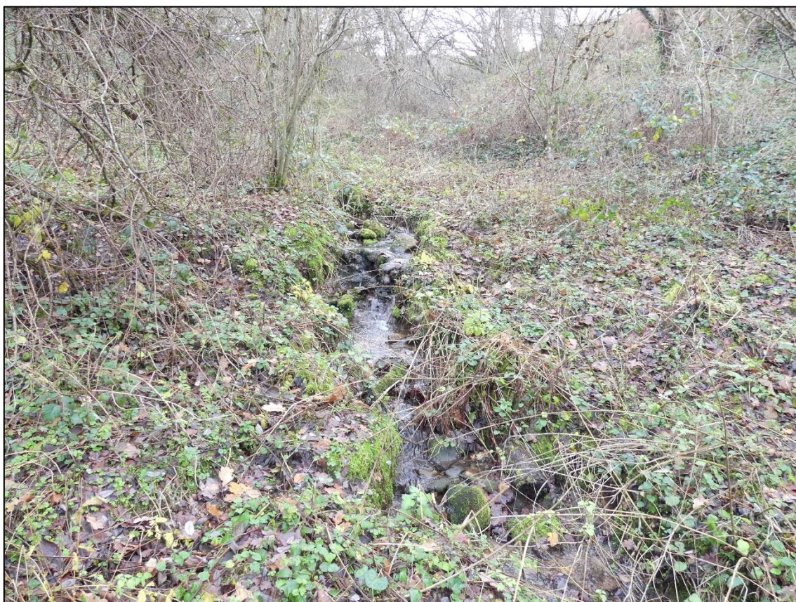
Vue 6 : Vue du talweg drainant au Nord du site de l'extension