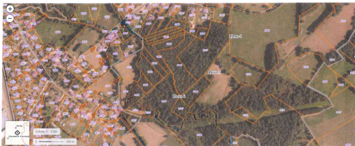
Photo 4 en direction du sud ouest