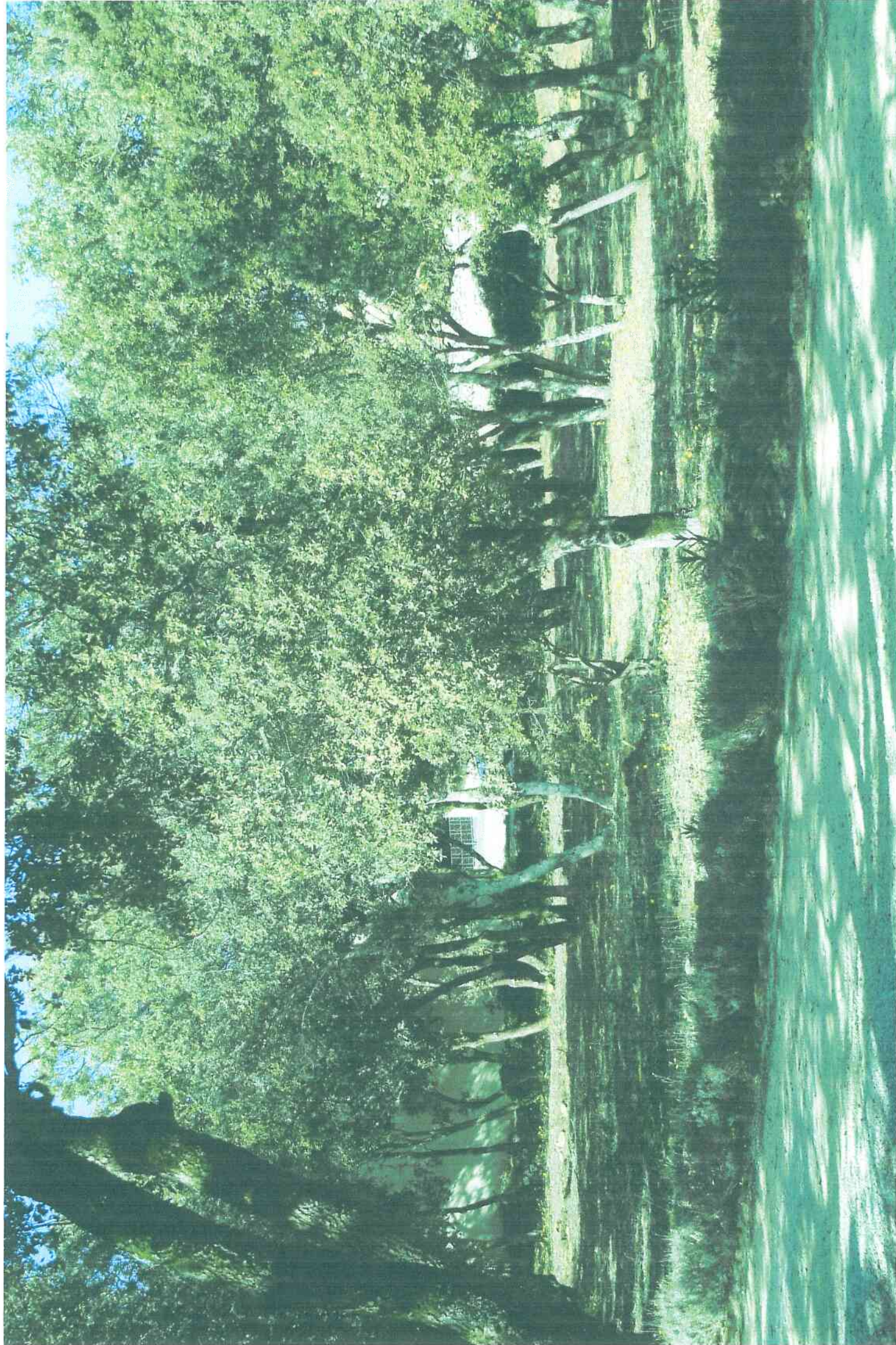
22/10/2022 Photo 1