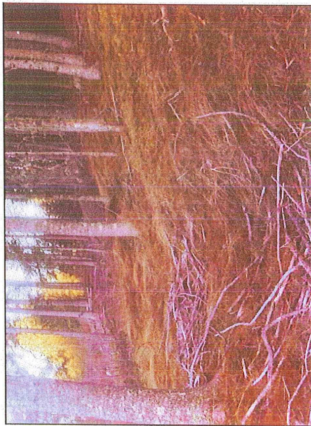
Photos prises en octobre 2011 concernant la zone de création de la piste 3