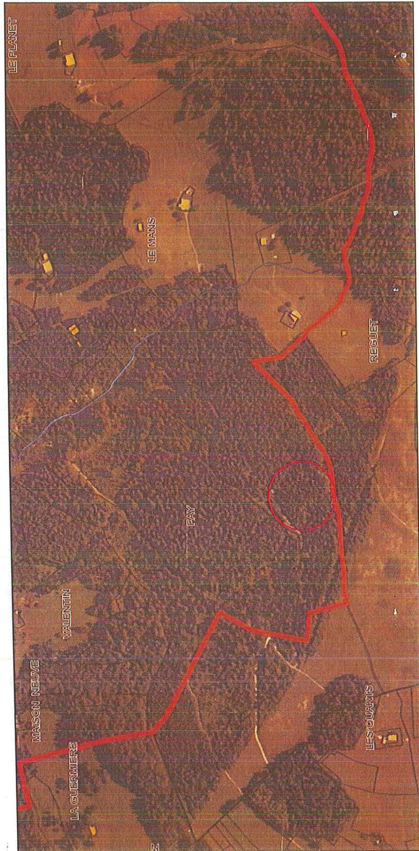
Photo aérienne montrant les abords du projet concernant la piste n°4