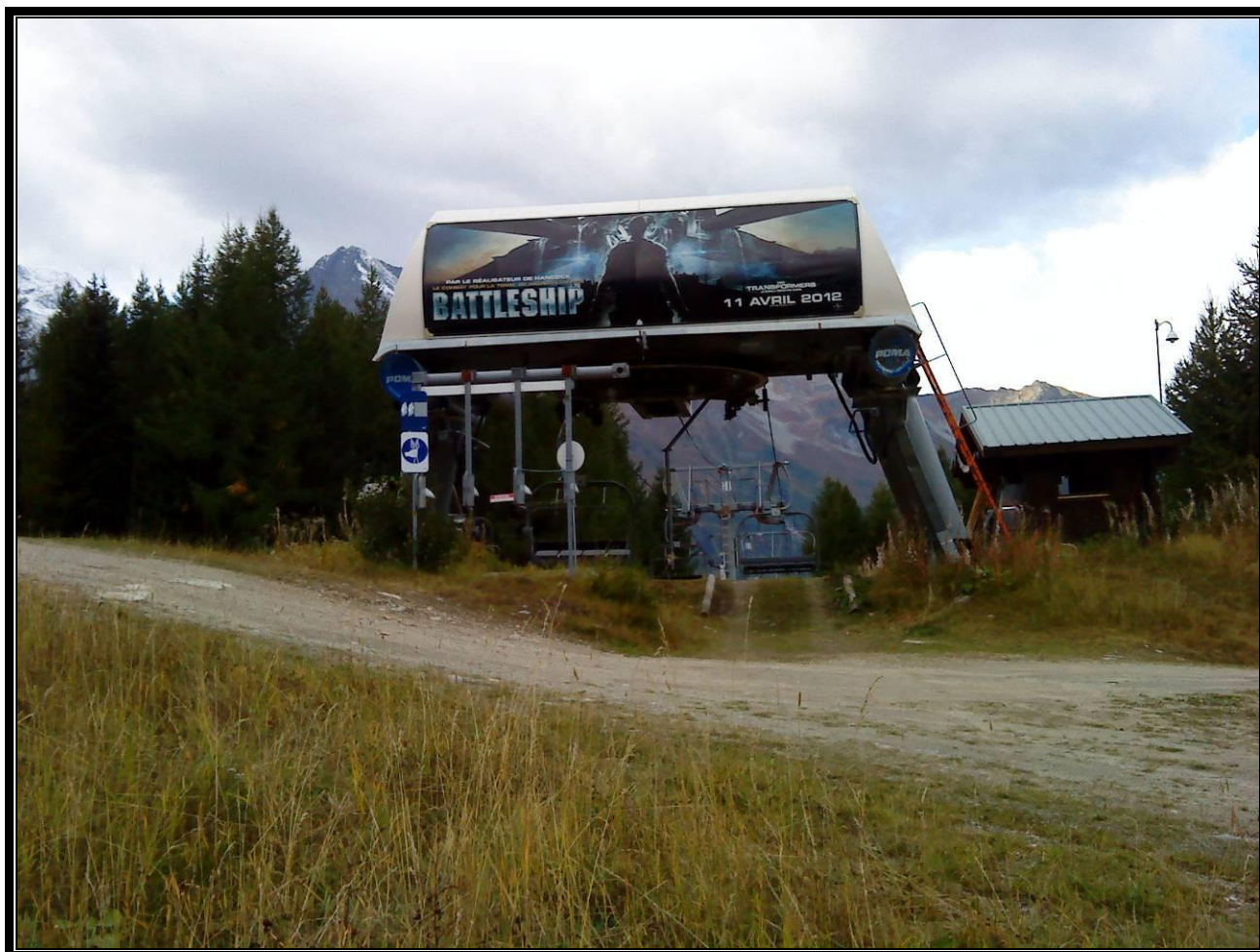
Photographie 4 : Vue de la gare d'arrivée