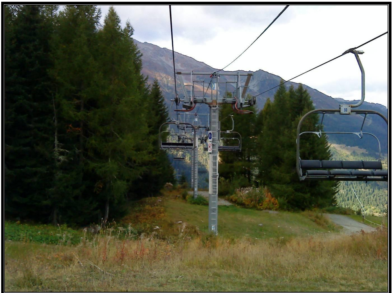
Photographie 2 : Vue de la ligne au niveau du P9