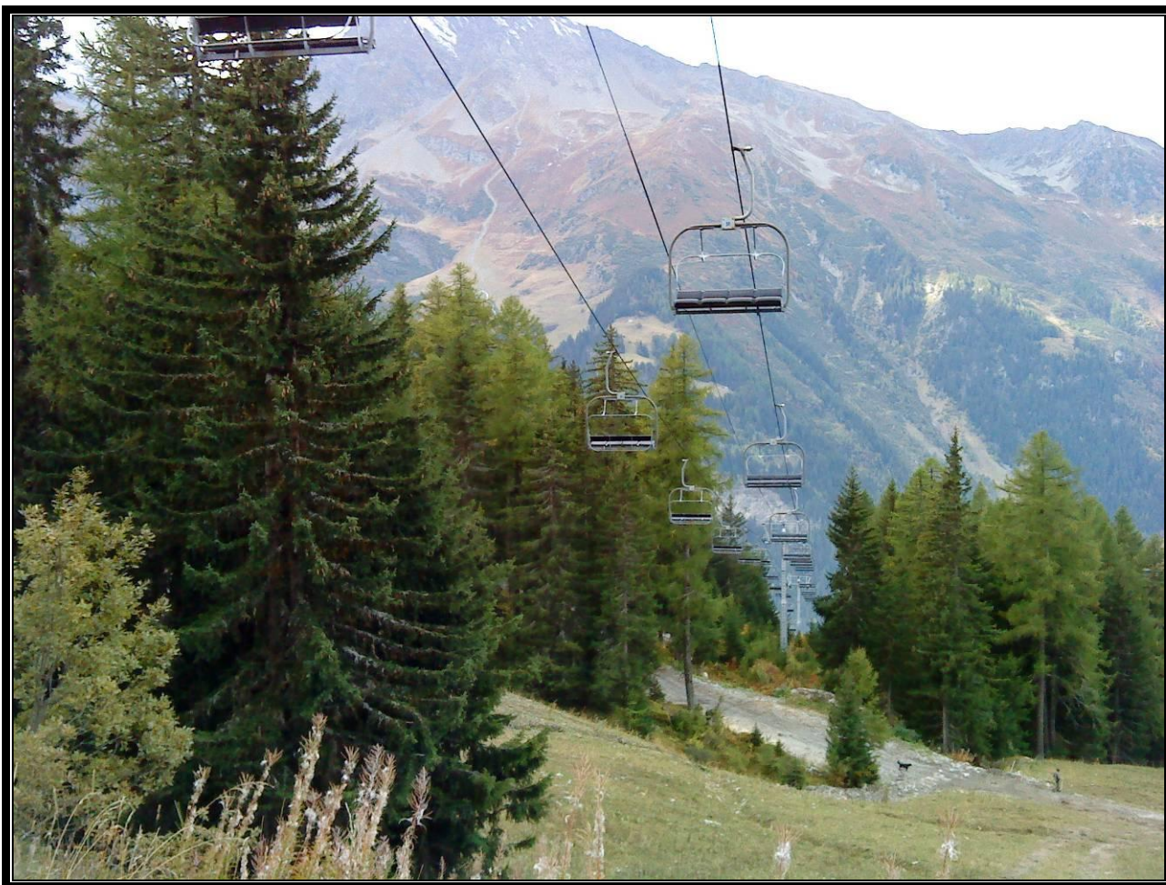
Photographie 3 : Vue de la ligne