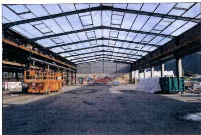
Vue C : A l'intérieur de l'ancienne entreprise, en direction N-O