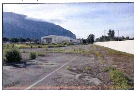
Vue A : Depuis l'angle Ouest du site