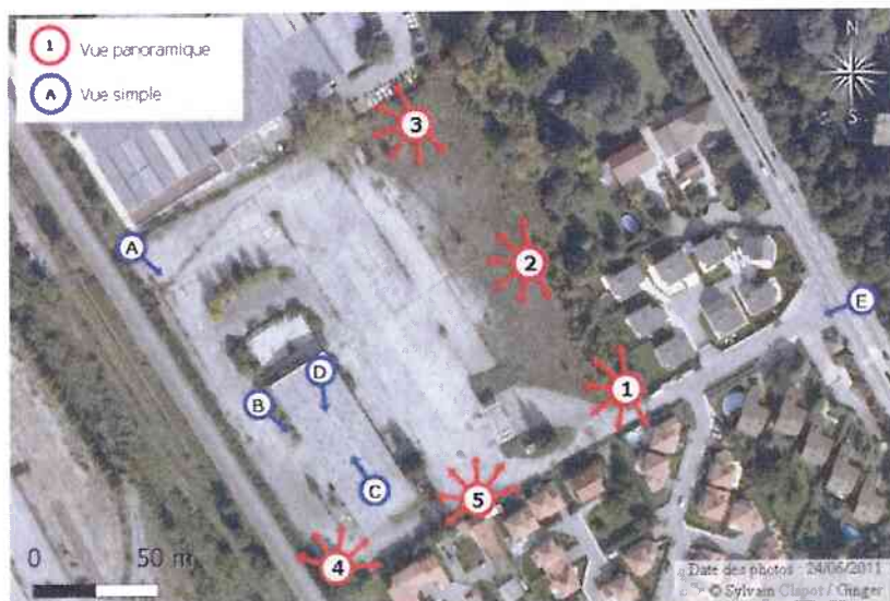
Vue n°1 : depuis le portail d'entrée du site