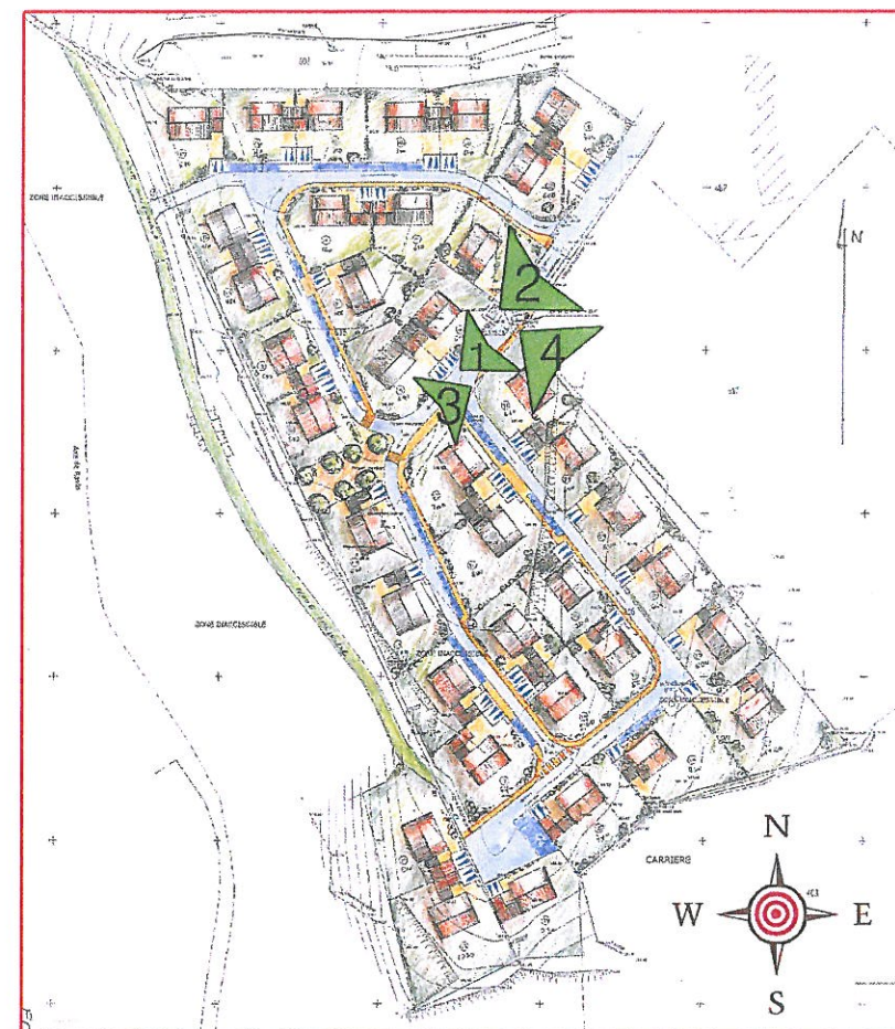
«Le Coteau de Sardagne»