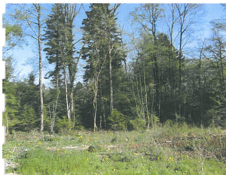
Vue sur les boisements, au sud du site, à proximité du hangar