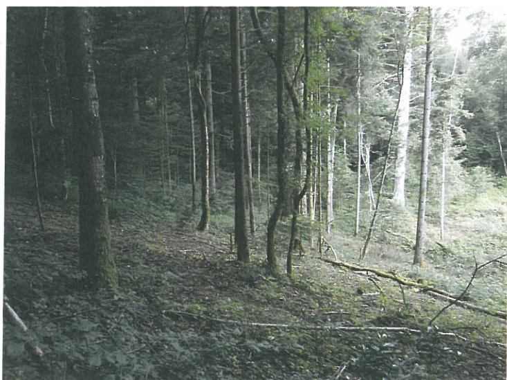
Au niveau des boisements, au Nord du site, en direction du ruisseau « la Gurnaz »