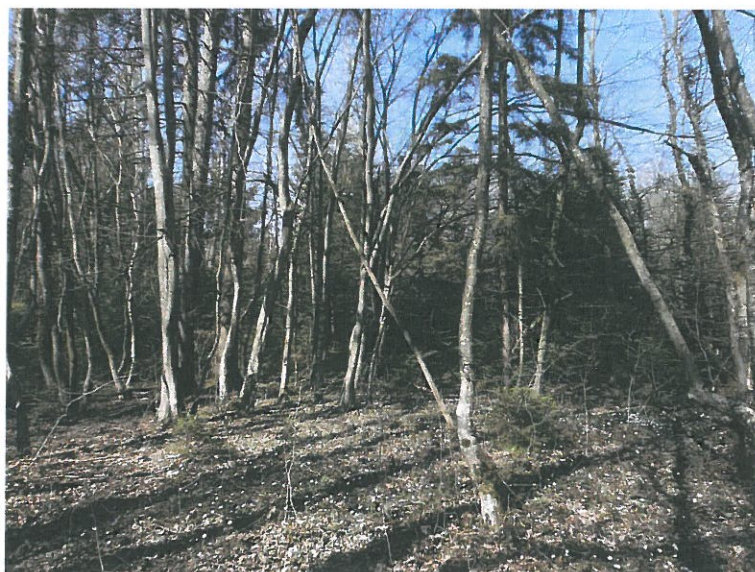
Au niveau de la hêtraie, au centre ouest du site