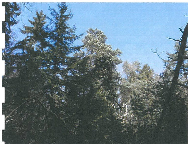
Au niveau du boisements, dans la moitié sud du site