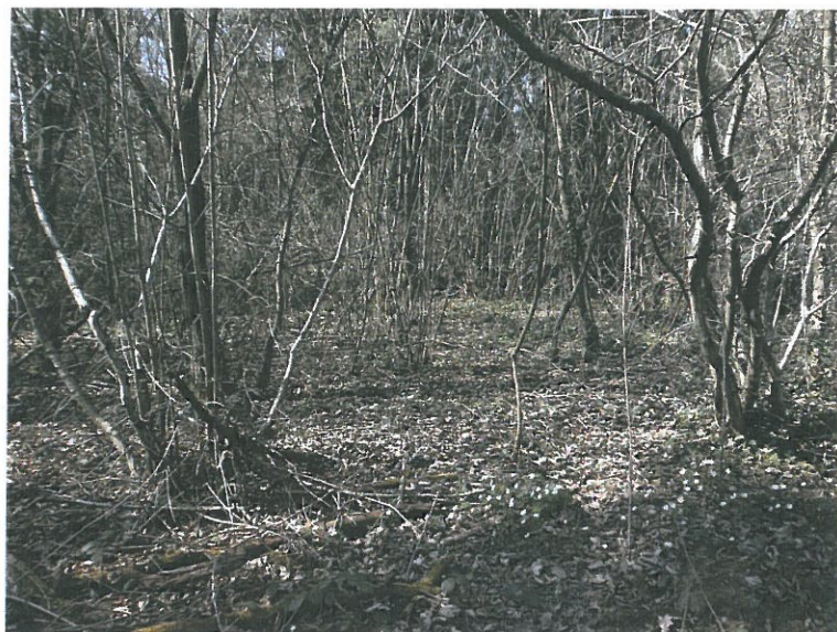
Au niveau du taillis de noisetiers, au sud du site