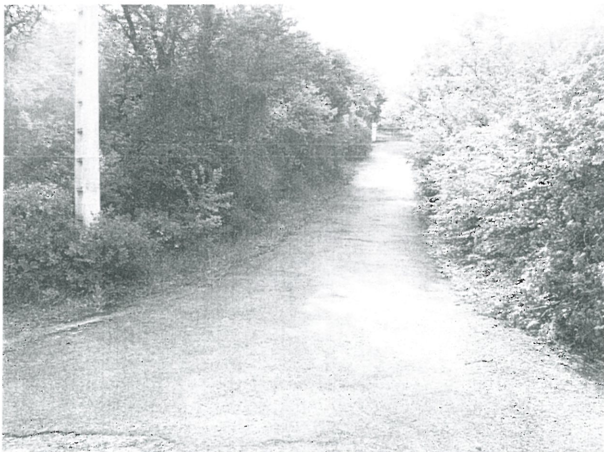
Photographie n° 2