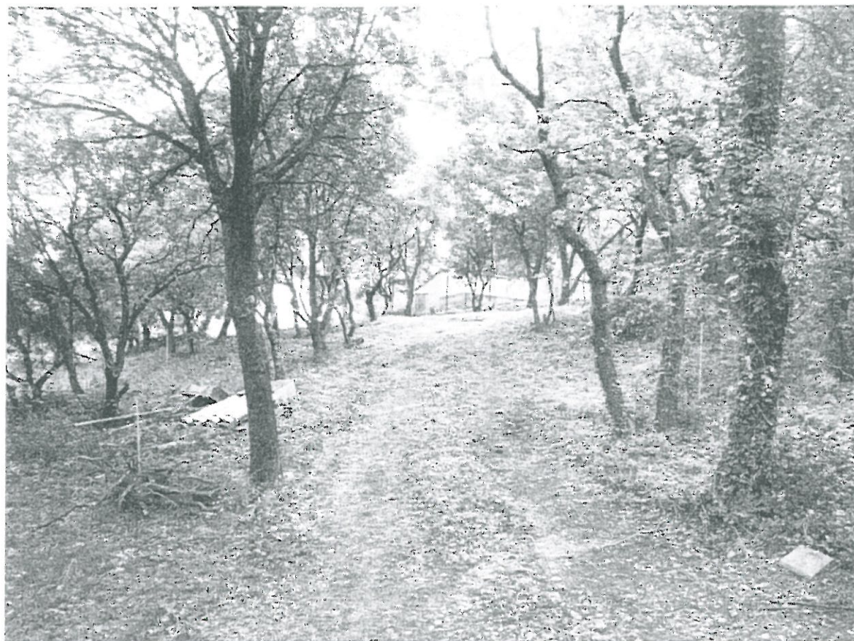
Photographie n° 2