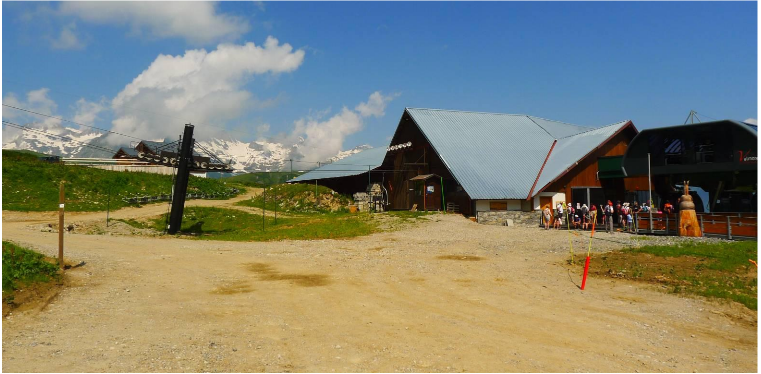
Photographie 2 : Vue d'ensemble de la ligne