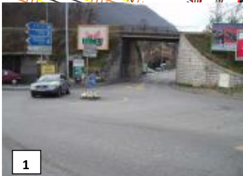
Giratoire existant RD2 / RD1206