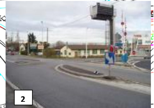
Carrefour « bretelle A40 / RD2 »