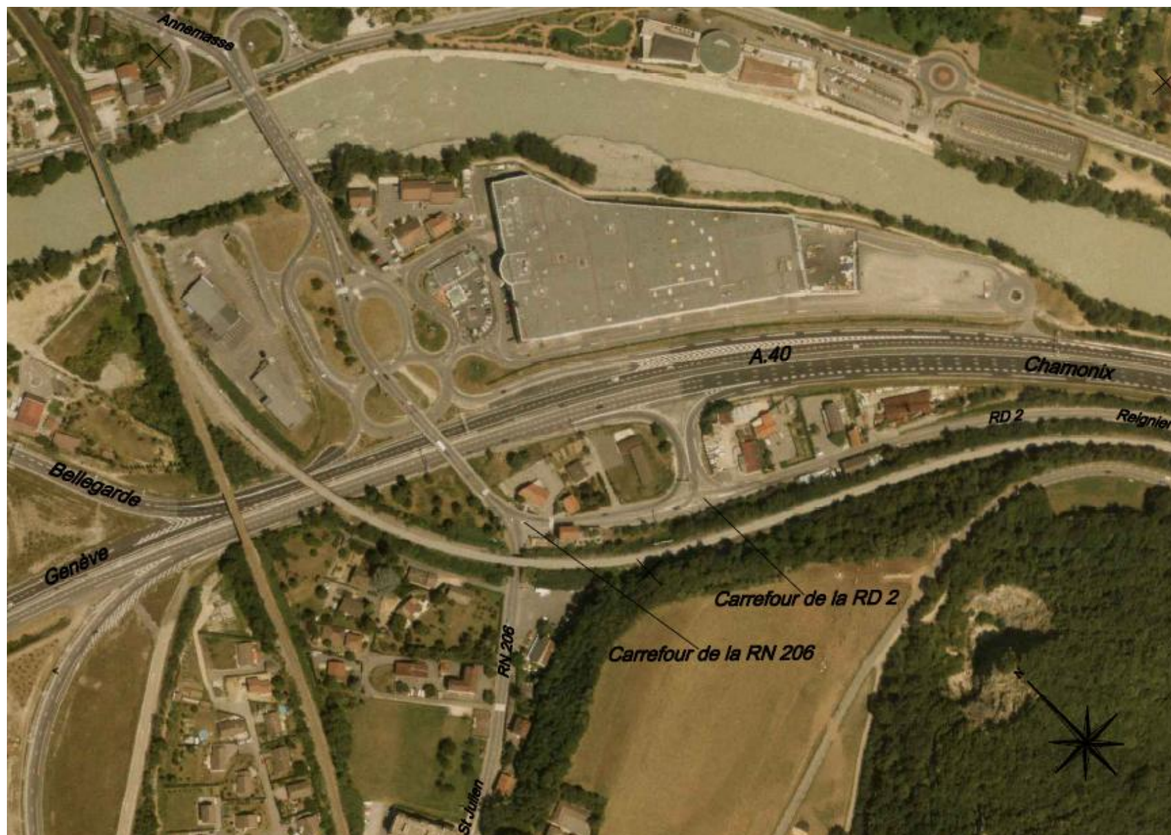
Vue aérienne des abords du projet (EGIS, demande de principe septembre 2010)