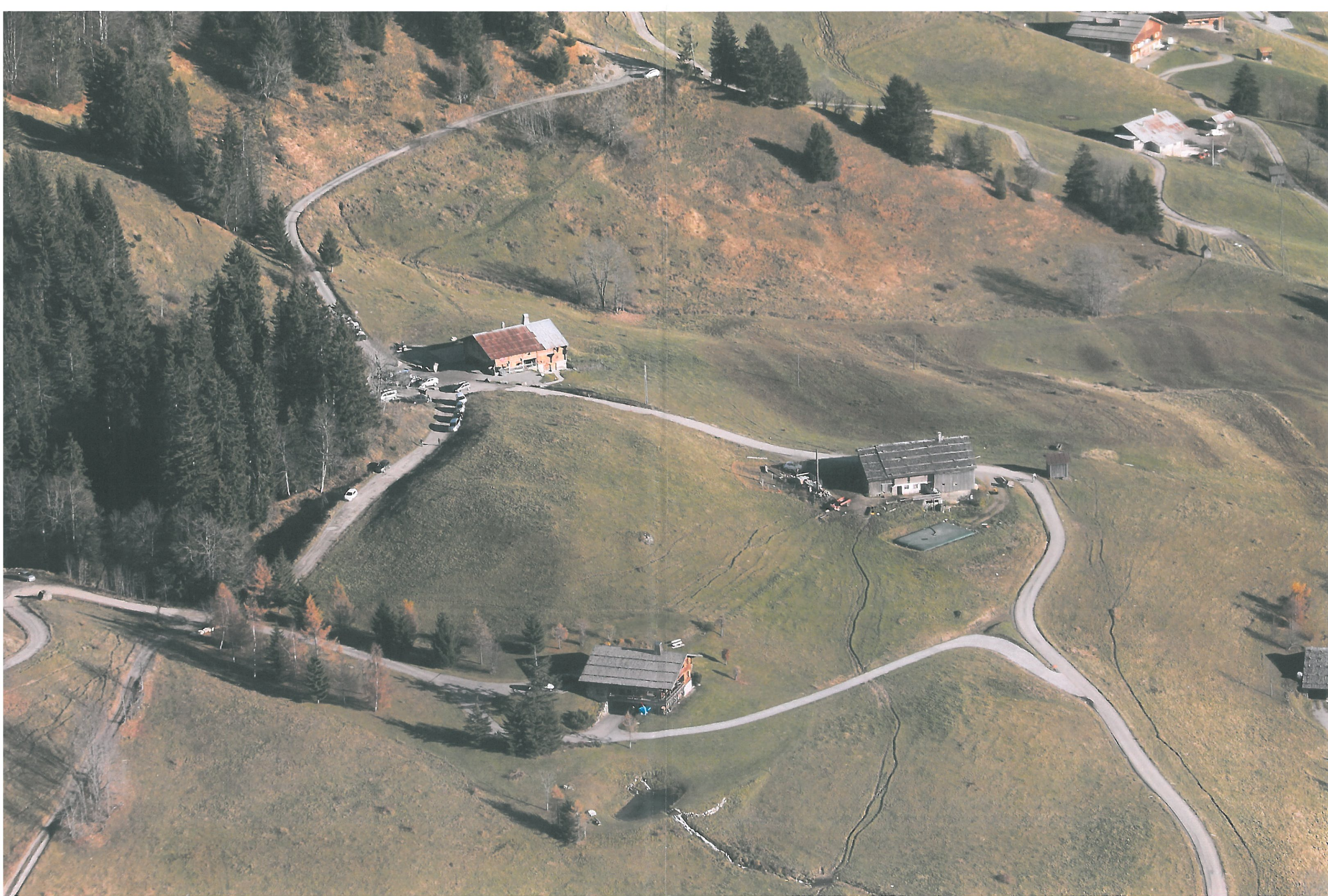
Site du Croix-une générale automne 2012