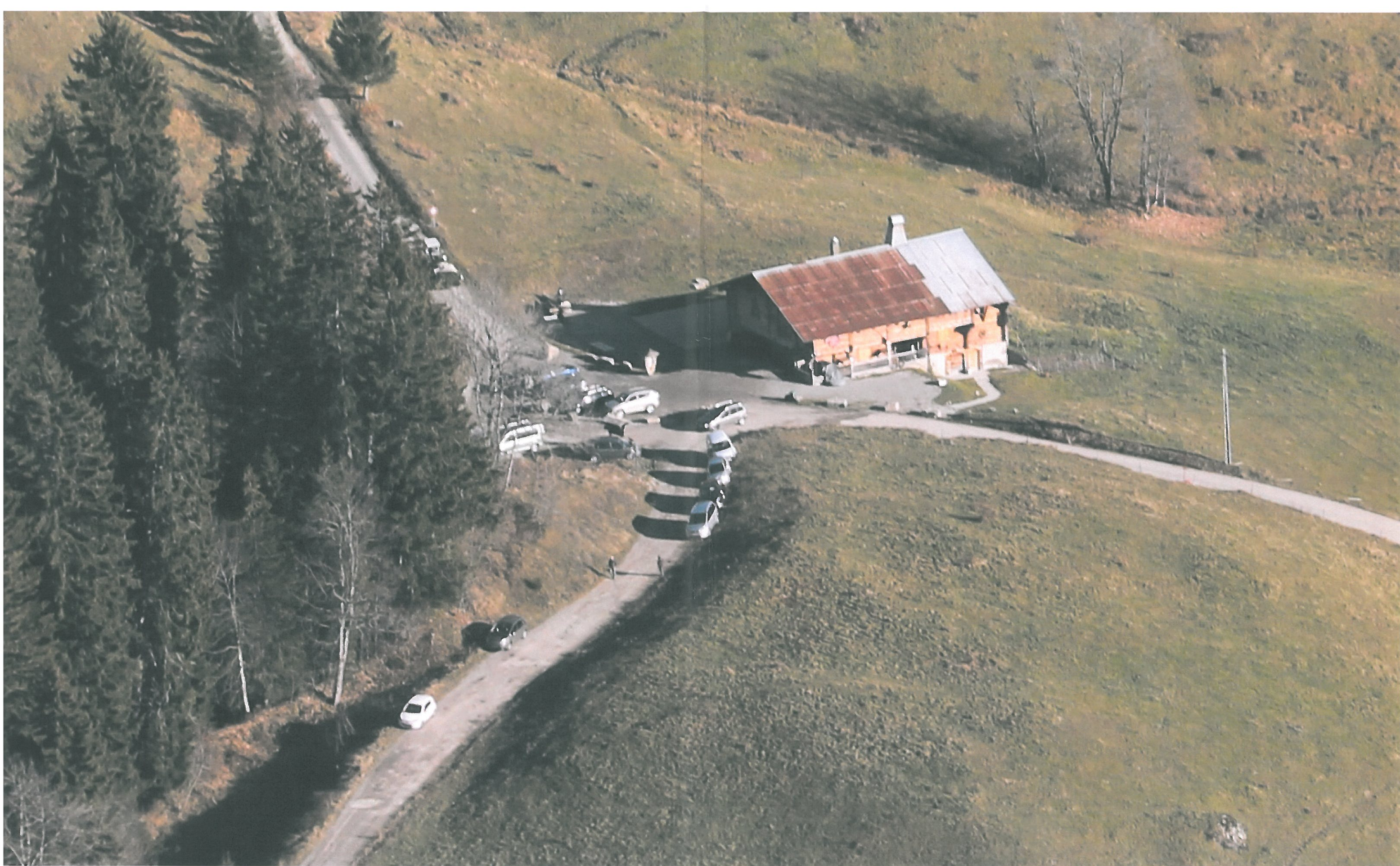
Site du Croix-vue rapprochée automne 2012