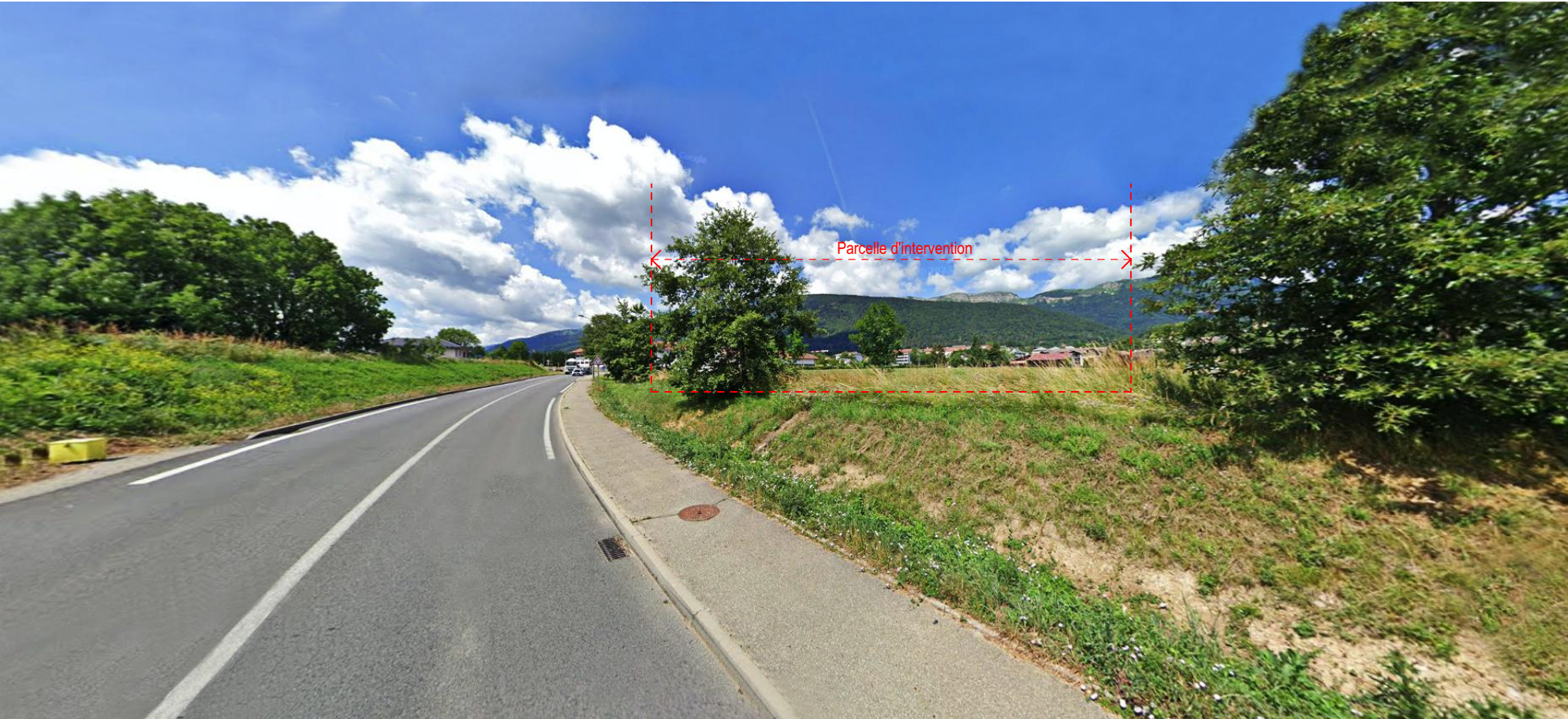
PC8-2 La parcelle, vue depuis l'Est et la rue du lycée (D984E)