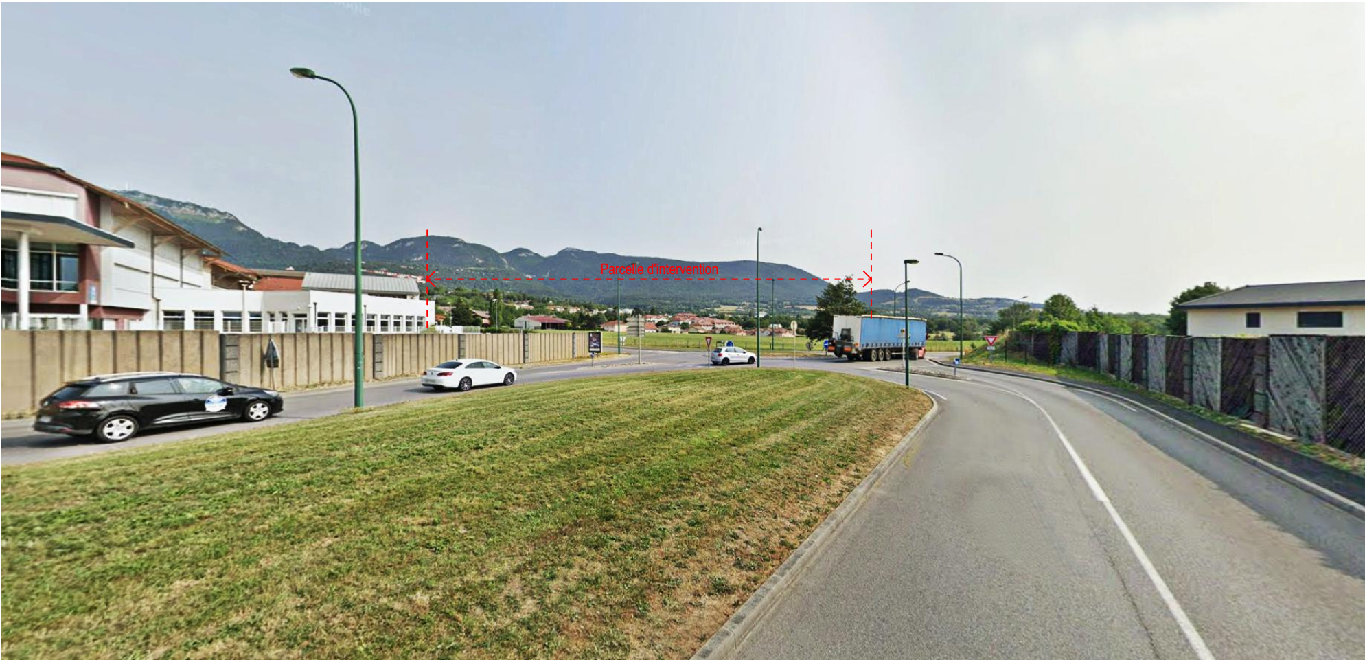
PC8-1 La parcelle, vue depuis la rue du Jura (D15C), à l'Ouest