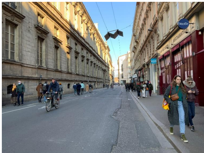
Rue Joseph Serlin – Lyon 1 er