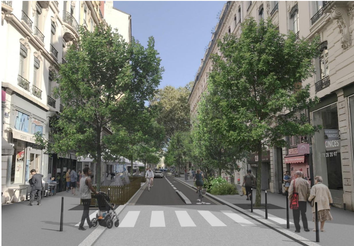
Rue de la Martinière – projet – Lyon 1 er