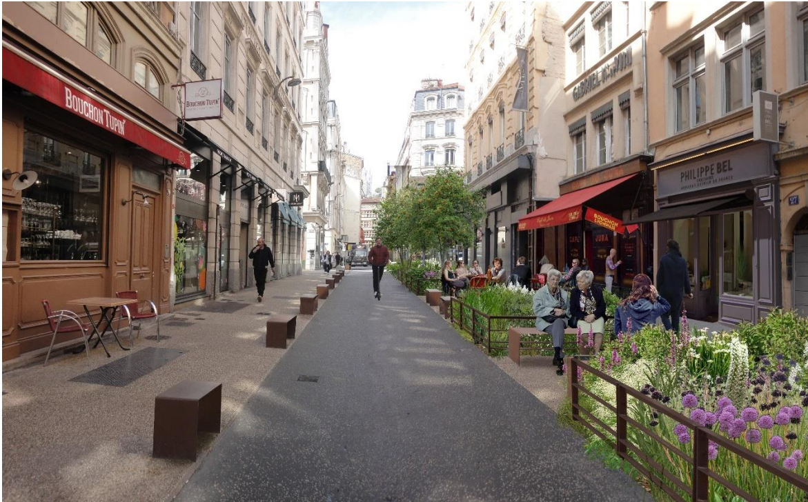
Rue Tupin – projet – Lyon 2 e