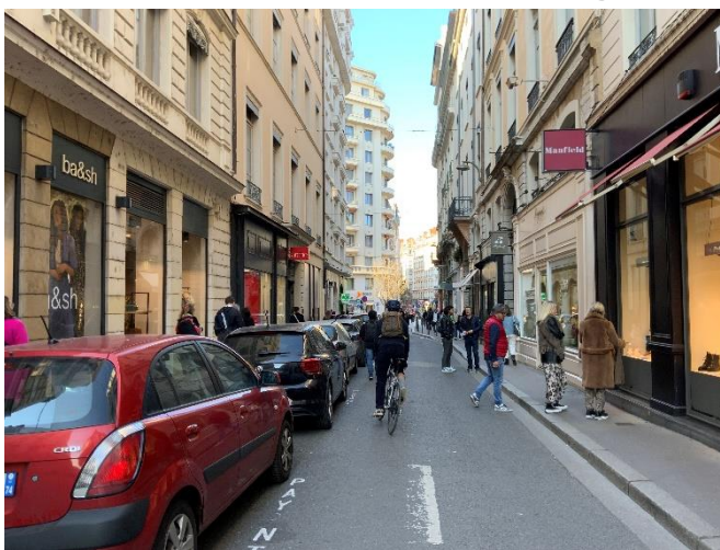
Rue Émile Zola – Lyon 2 e