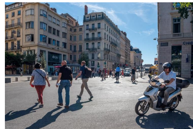
Rue de la République – Lyon 1 er