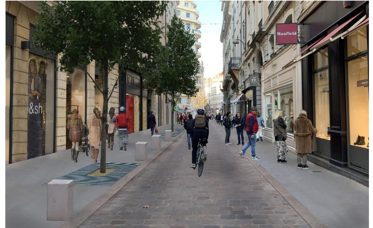
Rue Émile Zola – projet – Lyon 2 e