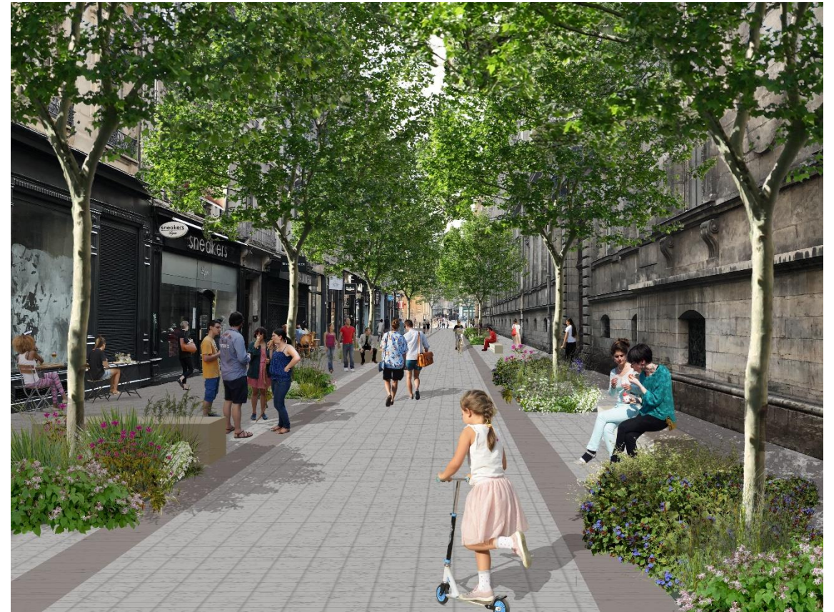
Rue Serlin – projet – Lyon 1 er