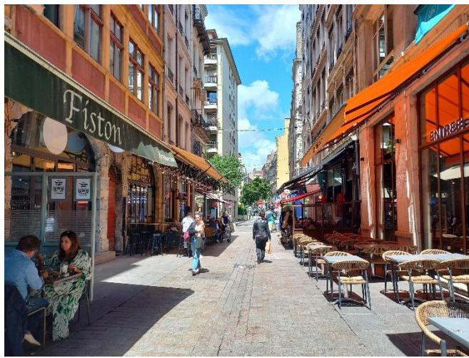
Rue Mercière – Lyon 2 e