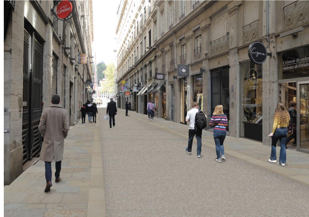
Rue de l'Ancienne Préfecture – projet – Lyon 2 e