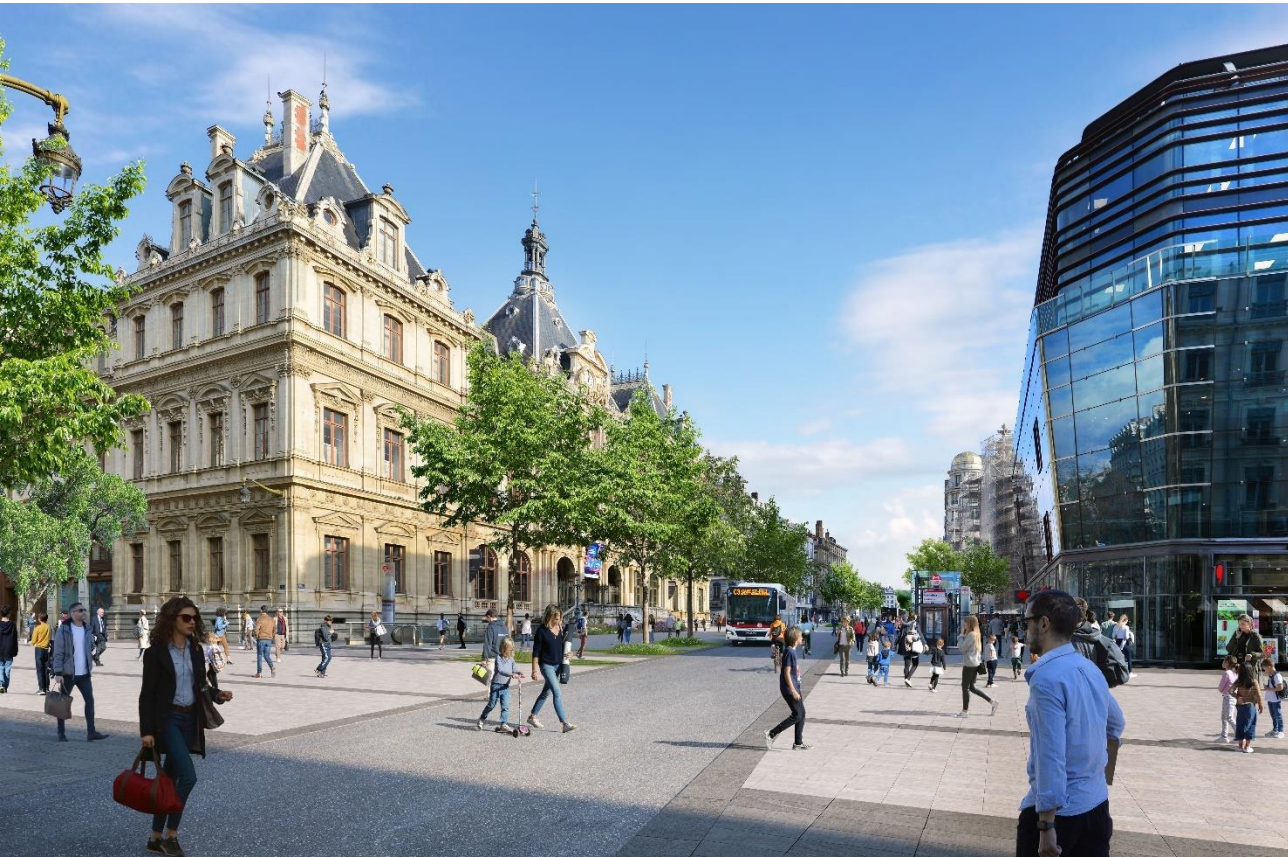
Place des Cordeliers – projet – Lyon 2 e