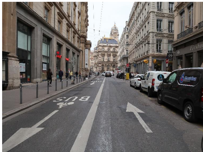
Rue Constantine – Lyon 1 er