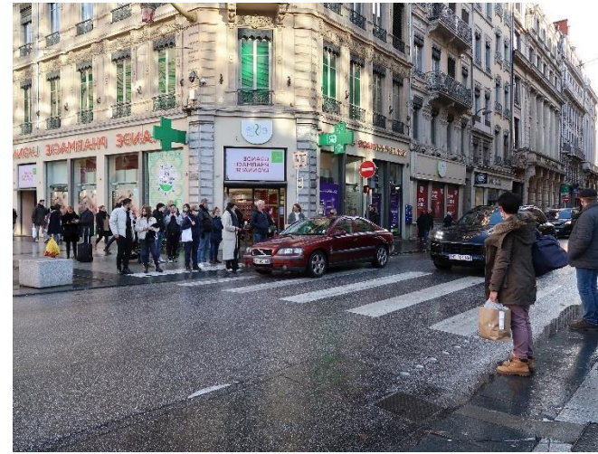
Rue Grenette – Lyon 2 e