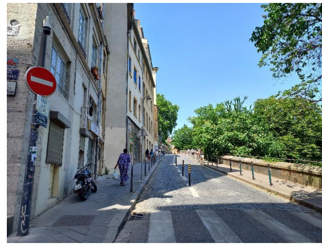
Montée St Sébastien – Lyon 1 er